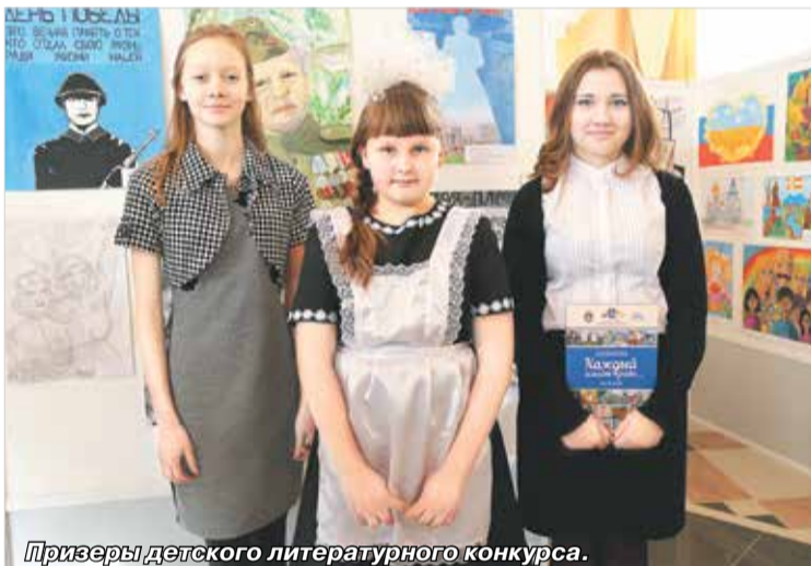
Призеры детского литературного конкурса.