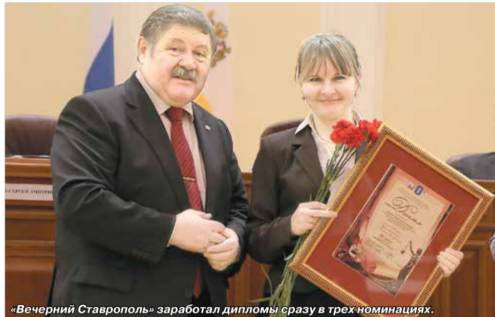
«Вечерний Ставрополь» заработал дипломы сразу в трех номинациях.

В номинации «Юридическая наука и образование» лауреатом премии стала профессор кафедры теории и истории госу-