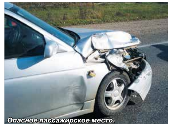
Опасное пассажирское место.

Но, увы... Молодой женщине, сидевшей на переднем пассажирском сиденье, помощь уже не понадобилась – удар встречной машины оказался для нее смертельным. Водитель и другой пассажир, находившиеся в «десятке», не смогли