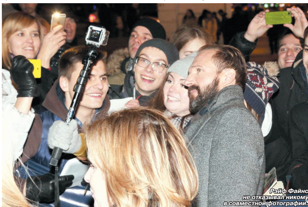
Рэйф Файнс не отказывал никому в совместной фотографии.