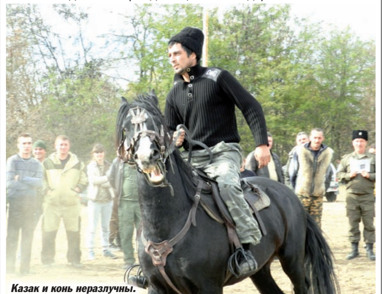
Казак и конь неразлучны.

Все победители награждены ценными подарками.