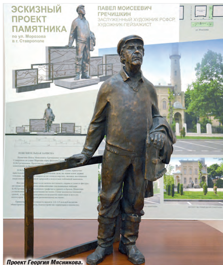
Проект Георгия Мясникова.

В состав комиссии, созданной по поручению главы администрации города Андрея Джатдоева, вошли известные в городе и крае деятели культуры и искусства, представители средств массовой информации, администрации города, общественники и ветераны Великой Отечественной войны.