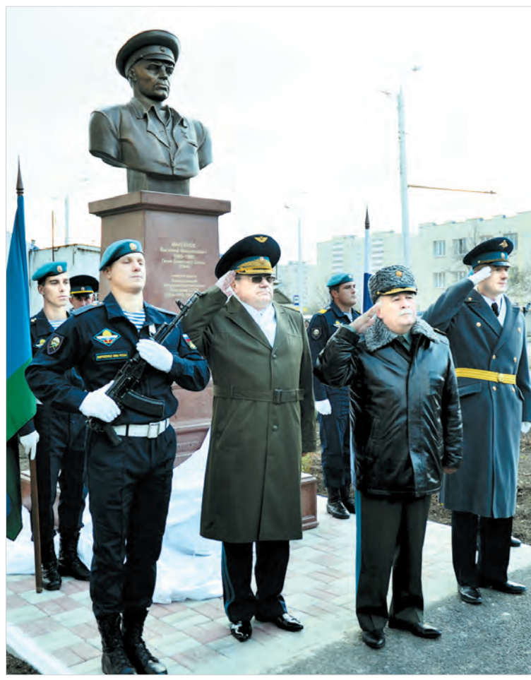
Валерий СОРОКОПУД. Фото автора.

В Ставрополе в День народного единства открыли памятник Герою Советского Союза, командующему Воздушно-десантными войсками СССР генералу армии В. Ф. Маргелову, легендарному военачальнику, чьи заслуги в создании современного облика этого рода Вооружённых сил настолько велики, что их до сих пор в шутку, но по заслугам называют «Войсками Дяди Васи».