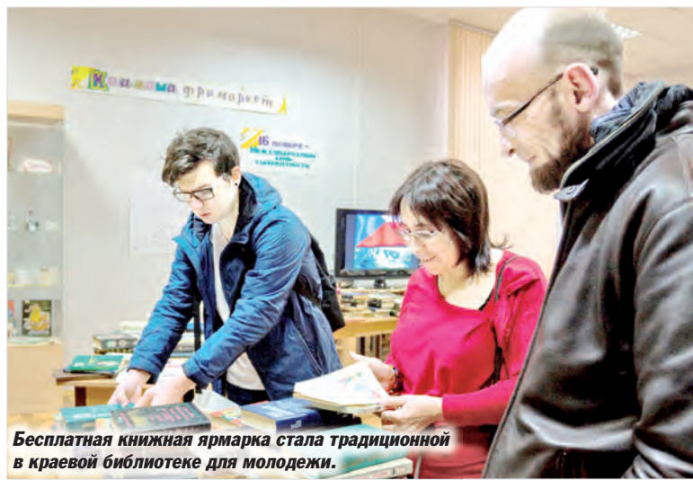
Бесплатная книжная ярмарка стала традиционной в краевой библиотеке для молодежи.

В программе ярмарки прошел мастер-класс по скрапбукингу, участники которого собственными руками смастерили облож-