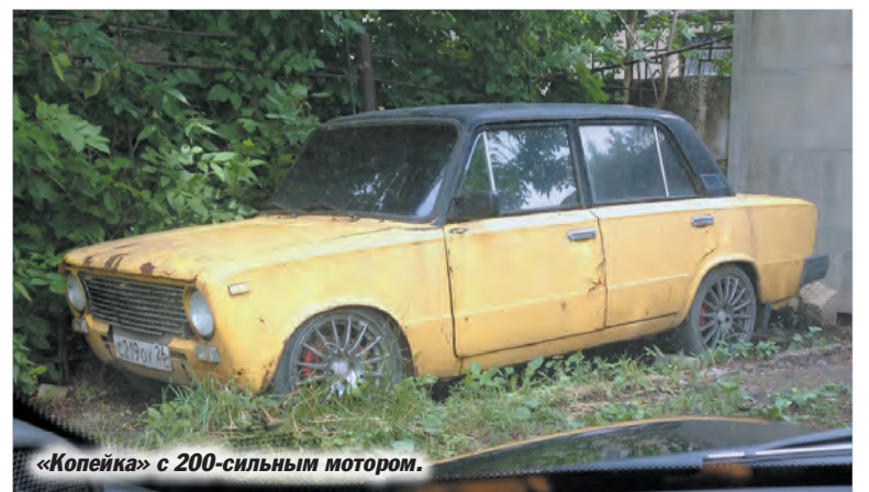
«Копейка» с 200-сильным мотором.