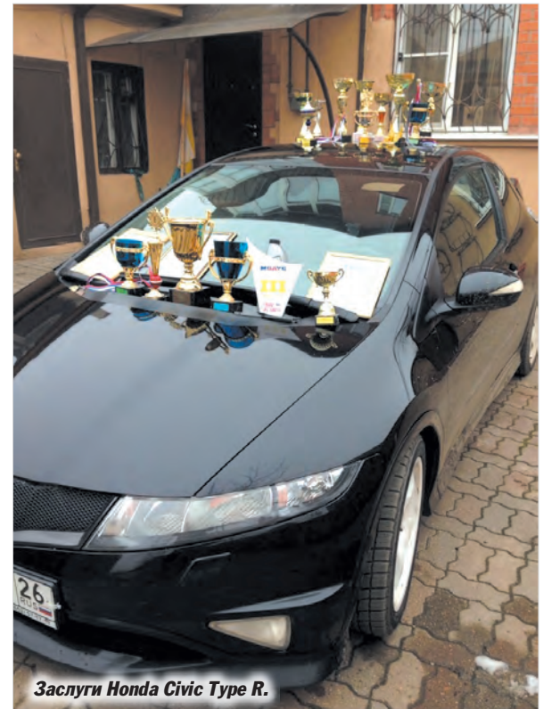
Заслуги Honda Civic Type R.

да должна состоять из пяти человек. В таком случае в копилке команды будут набираться больше баллов, а следовательно - вырастет шанс занять призовые места в общекомандном зачете.