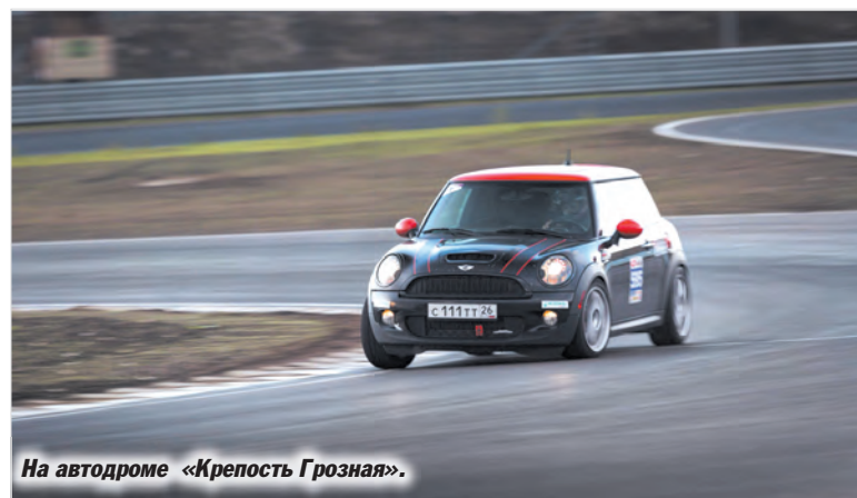
На автодроме «Крепость Грозная».