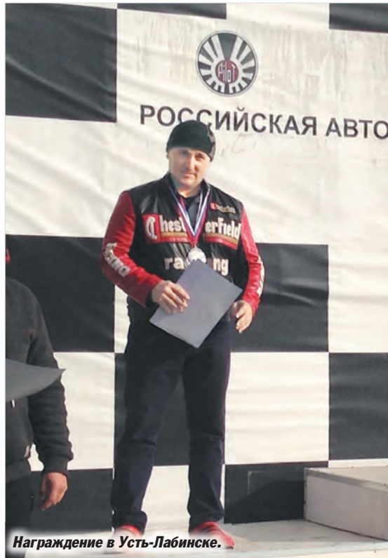
Награждение в Усть-Лабинске.