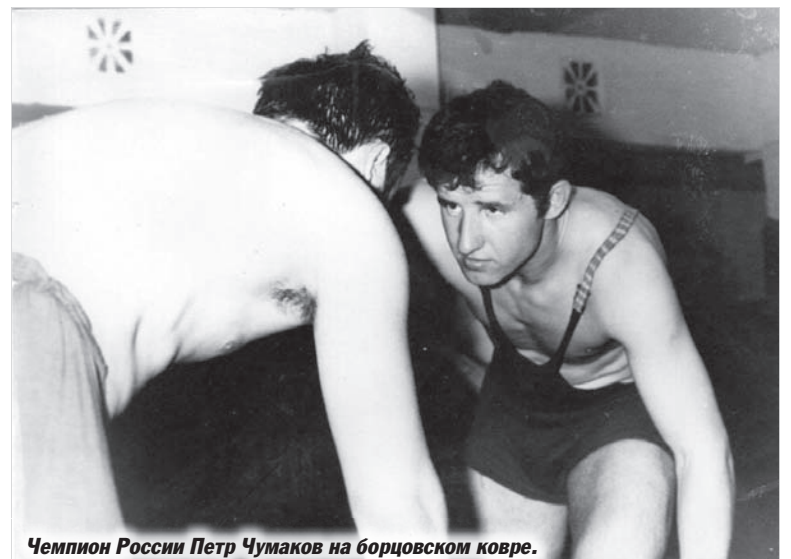
Чемпион России Петр Чумаков на борцовском ковре.