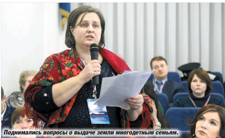
Поднимались вопросы о выдаче земли многодетным семьям.