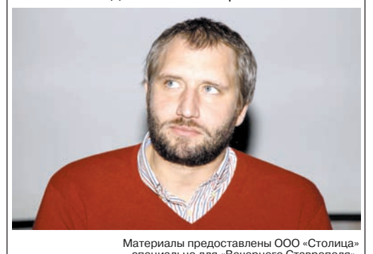
Материалы предоставлены ООО «Столица» специально для «Вечернего Ставрополя».

Никакой трагедии не произошло, - прокомментировал Юрий Быков. - Я всегда говорил, что режиссура в продюсерском кино - наемная работа. Прокатный фильм - это коммерческий проект, где решение принимает автор проекта - продюсер. Режиссер только инструмент. Не подошел один инструмент или отработал свое - поменяли. У меня никогда на этот счет иллюзий не было. Надеюсь, не будет и у моих оппонентов, которые всегда упрекали меня за такую позицию. Решение было принято обоюдно. Мы расстались без обид и всяческих претензий.