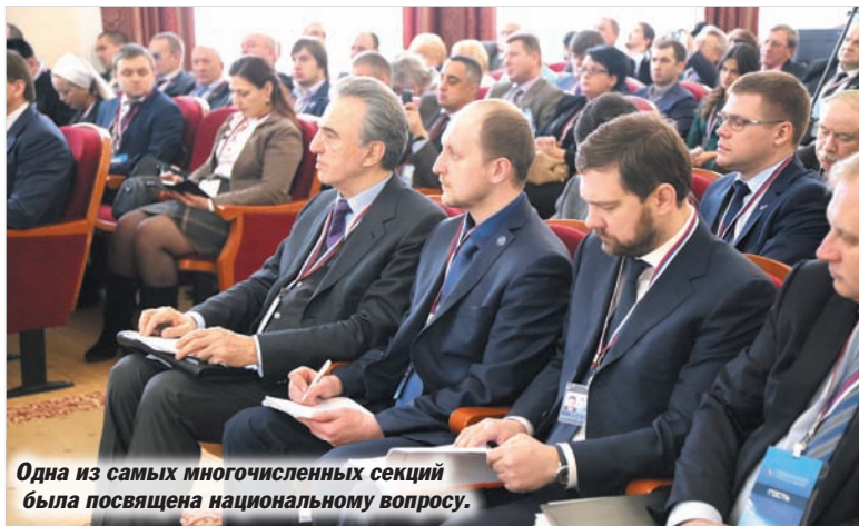
Одна из самых многочисленных секций была посвящена национальному вопросу.