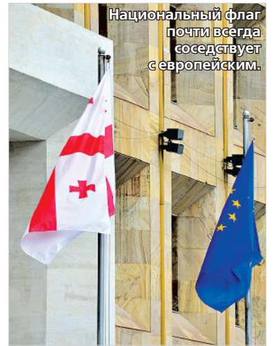
Национальный флаг почти всегда соседствует с европейским.