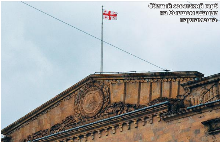
Сбитый советский герб на бывшем здании парламента.