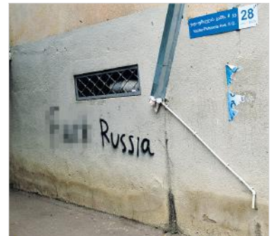
Один из немногих встреченных нами случаев антироссийской агитации.