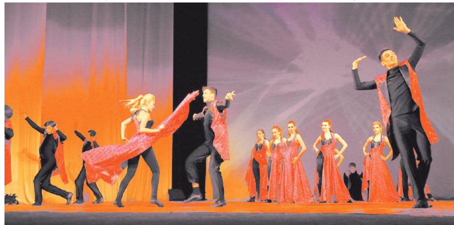
«Ставрополь» в новой ипостаси.