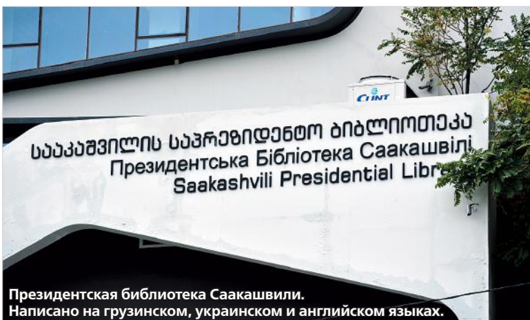
Президентская библиотека Саакашвили. Написано на грузинском, украинском и английском языках.