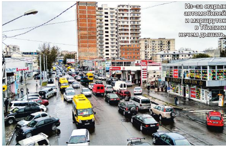
Из-за старых автомобилей и маршруток в Тбилиси нечем дышать.