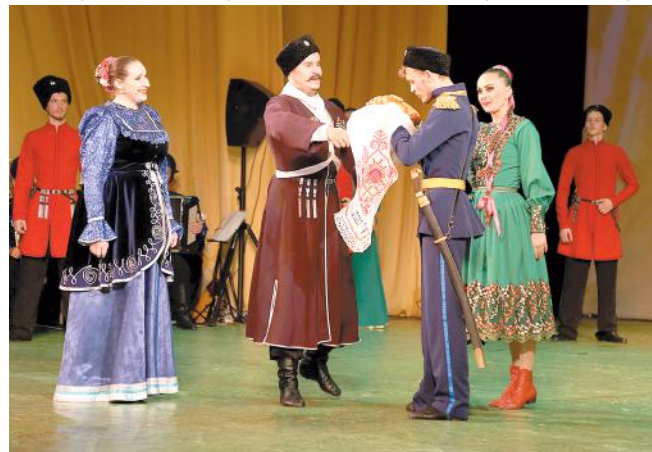
Сцена из музыкально-хореографического спектакля «Троица на Тереке».