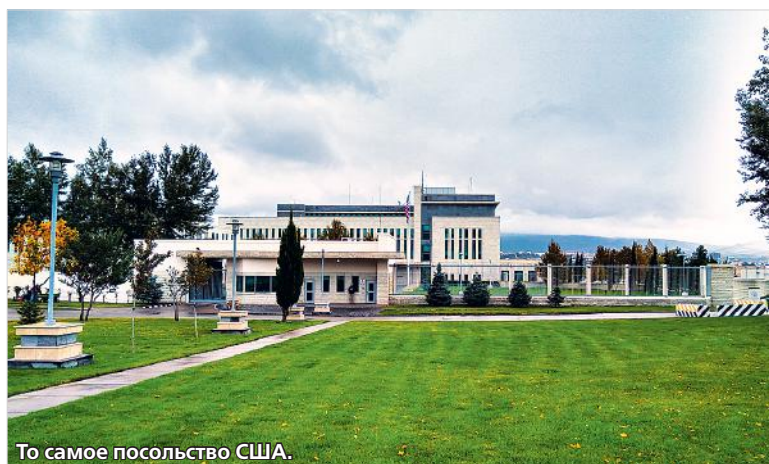
То самое посольство США.

герб Страны Советов, который в угаре мелкопоместной независимости сбили, но не целиком: внутри выдолбили, вокруг оставили. Так и везде в городе. В своей борьбе с наследием нашей совместной истории грузинские власти, к счастью, непоследовательны, а народ и вовсе протрезвел за четверть века. Что народу ни внушай, как историю ни переписывай, а люди ещё не разучились сопоставлять жизнь «тогда» и «сейчас». Во всяком случае, пока живо поколение, которое помнит советский Тбилиси.