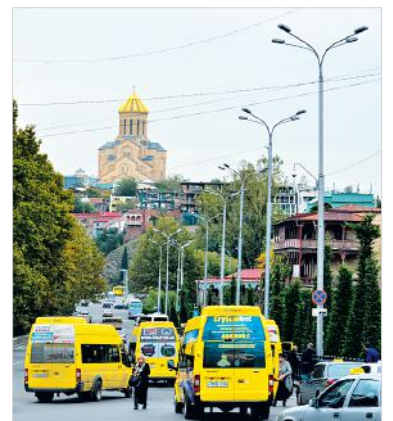
Маршрутка – основной вид общественного транспорта.

Насколько власти Грузии боготворят всё западное, настолько же они ненавидят всё советское. Десоветизация здесь тотальная, повальная и нелепая. На проспекте Руставели находится даже целый Музей советской оккупации. А через дорогу от него стоит бывшее здание грузинского парламента, на котором раньше красовался