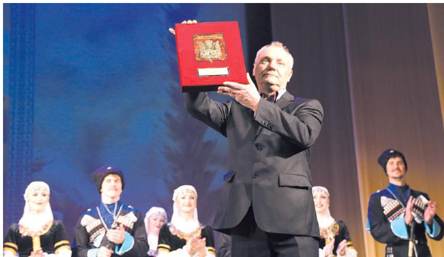
Заслуженный артист России Иван Громаков принимает поздравления.