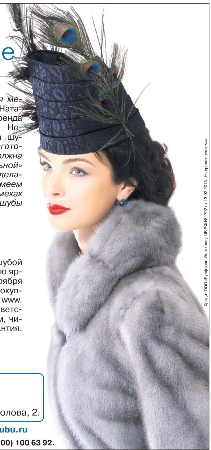
Кредит ООО «Русфинбанк» лиц. ЦБ РФ № 1792 от 13.02.2013. На правах рекламы.

Телефон горячей линии 8 (800) 100 63 92.