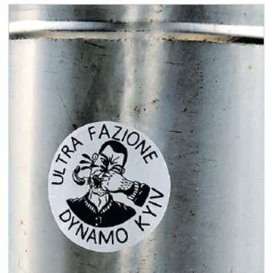
Часто встречаются артефакты грузинско-украинской дружбы.