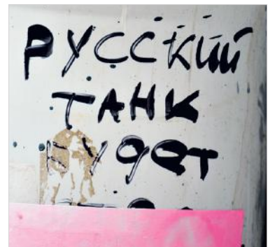
Нет, не будет.