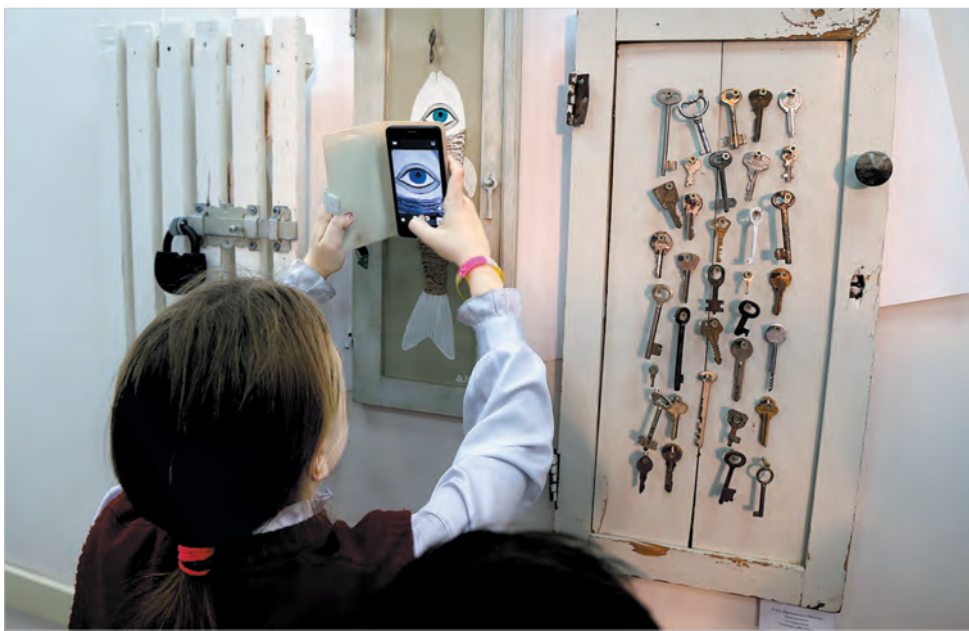
Учащиеся детской художественной школы – самые благодарные ценители дизайнерского искусства