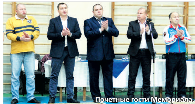
Почетные гости Мемориала.

В Невинномысске на базе спортивно-культурного комплекса «Олимп» завершился XXI открытый краевой турнир по дзюдо среди юниоров, посвящённый памяти заслуженного тренера России Макара Багдасаряна, организованный краевым министерством физической культуры и спорта, федерацией дзюдо и самбо Ставропольского края при поддержке администрации Невинномысска.