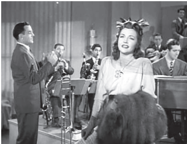
Кадр из фильма «Серенада солнечной долины».

анскими волнами прилива и отлива, когда они на отливе вначале выбрасывают на берег тысячи жителей водной стихии, оставляя на суше множество рыбешек, крабов, всевозможных моллюсков, но немногие из них доживают до прихода спасительного прилива: либо их съедают чайки, либо они сами погибают от безводья. А затем, некоторое время спустя, водным приливом оставшиеся жители морской стихии (те, кому повезло) возвращаются в отчий дом.