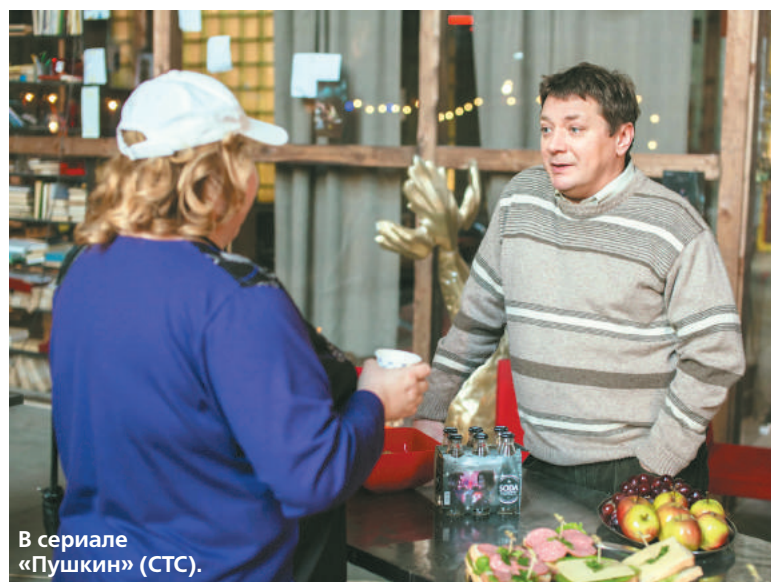
В сериале «Пушкин» (СТС).

Актер считает, что испортить продукты можно везде, даже в ресторане