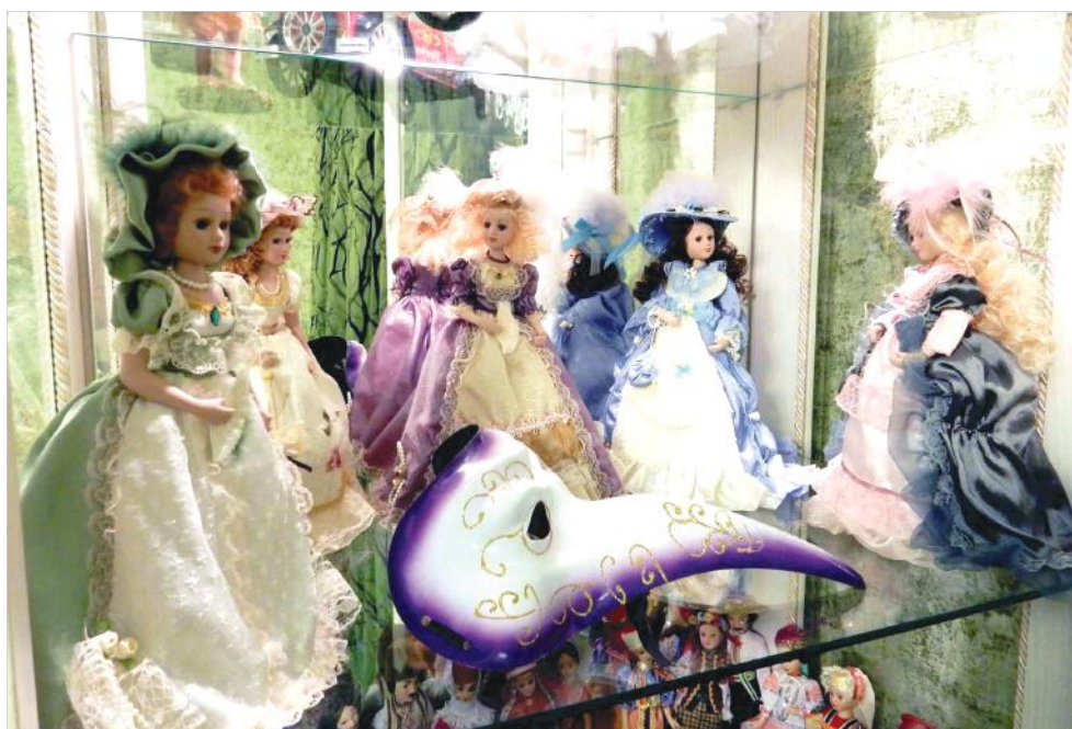
Мистическая пятёрка, напомнившая о себе во сне.