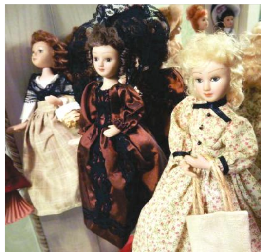
Соня Мармеладова – героиня романа «Преступление и наказание» Ф.М. Достоевского.