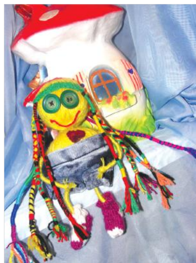
Джашка – хранительница домашнего уюта.