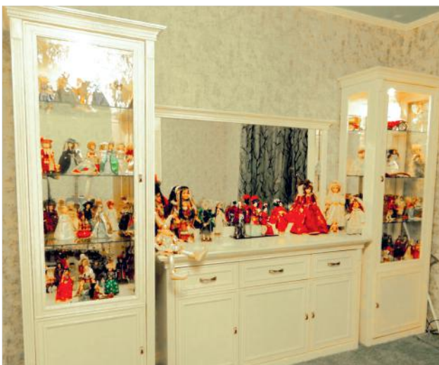
Первое, что видит гость, войдя в комнату с куклами.