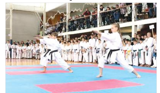
Выступают каратисты Ставропольской ДЮСШ единоборств.