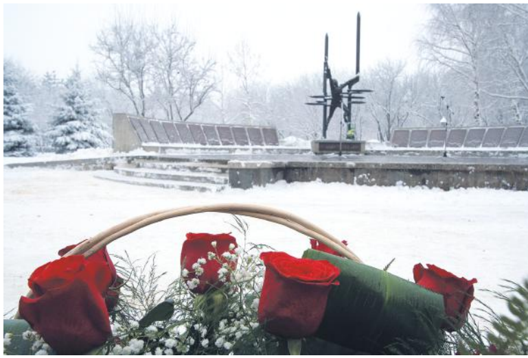
И через десятки лет — помним.

Федеральный инспектор по Ставропольскому краю Аппарата полномочного представителя