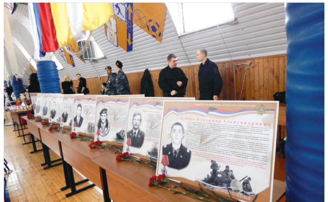
Пантеон погибших воинов спецназа.

По завершении турнира участникам соревнований, занявшим призовые места, были вручены почетные грамоты, медали и кубки оргкомитета.