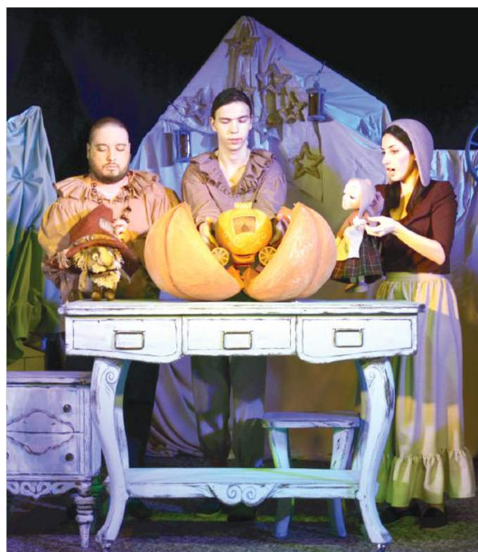
На глазах у зрителей тыква превращается в карету.