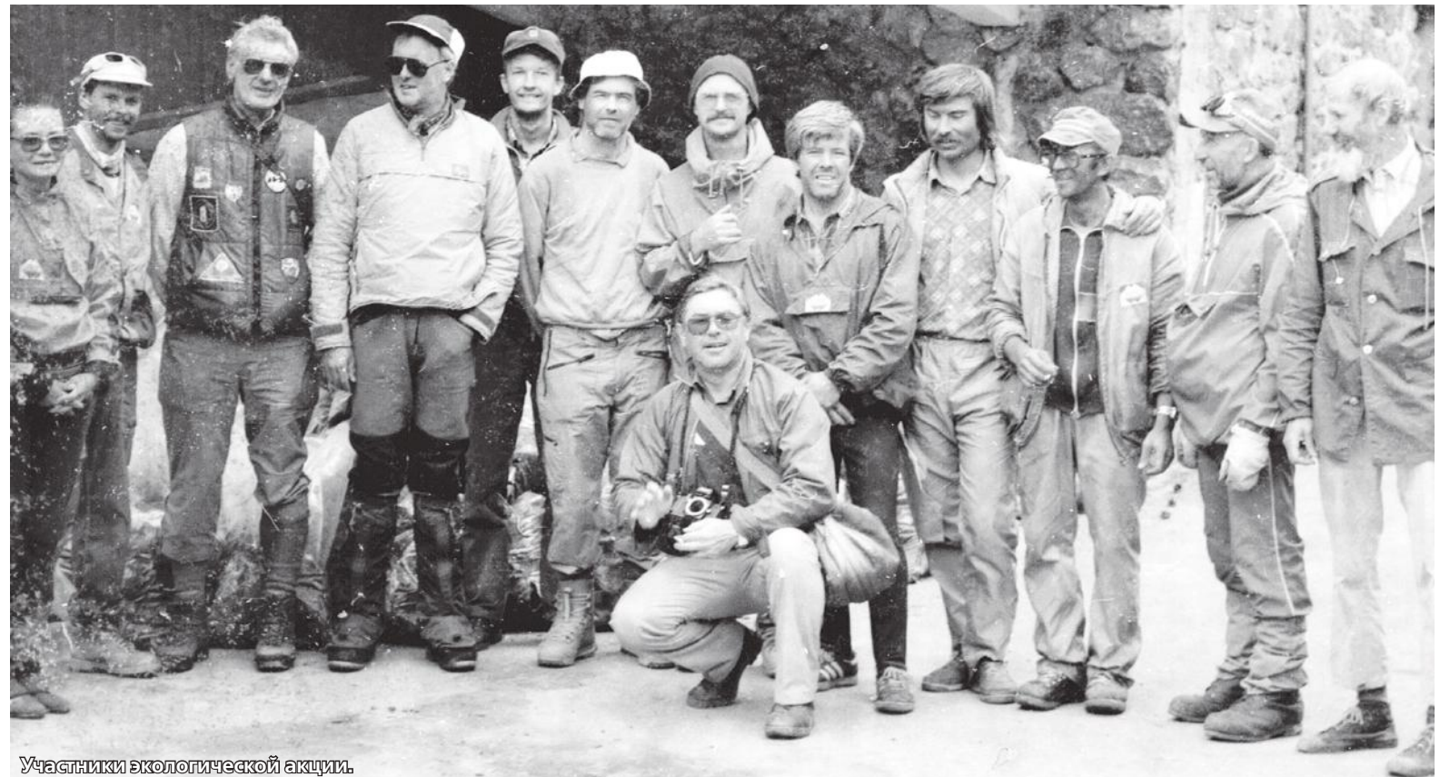
Участники экологической акции.