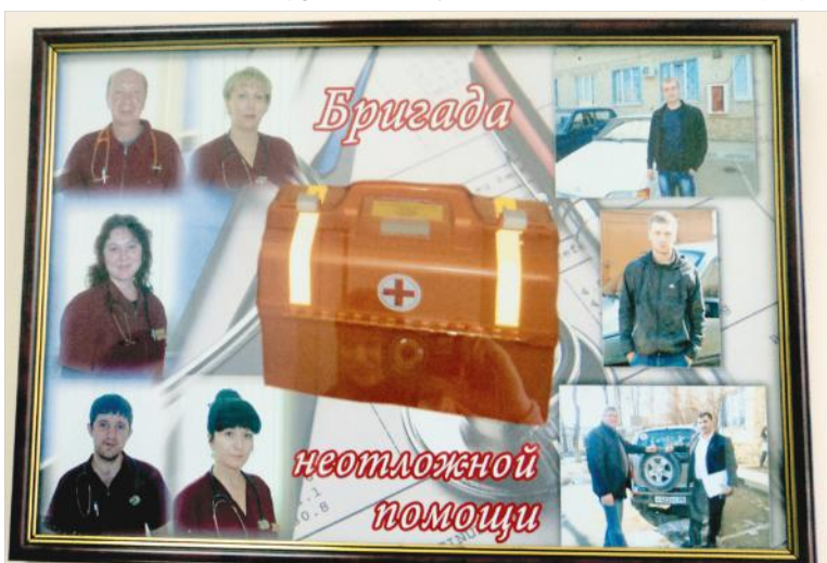
Служба неотложной помощи пишет свою историю.

P.S. После интервью мы побывали в двух поликлиниках Ставрополя, чтобы убедиться на месте, как работают кабинеты «неотложки». Удивительно: несмотря на то, что эти службы располагаются и в первой, и во второй поликлиниках буквально рядом с регистратурой, а о назначении кабинетов оповещала и табличка, посетители медучреждений затруднялись ответить на вопрос, где находятся эти кабинеты и есть ли они вообще. При том что на окошке регистратуры второй поликлиники, например, был указан и телефон «неотложки». Оно понятно: общение с этой службой больные имеют в основном только в момент обслуживания вызова врачом на дому. Поэтому сотрудники медицинских учреждений просили через газету проинформировать наших читателей: к «температуристам» больным ОРВИ вызывайте врача, не нужно куда-то ехать. «Неотложка» придет к вам.