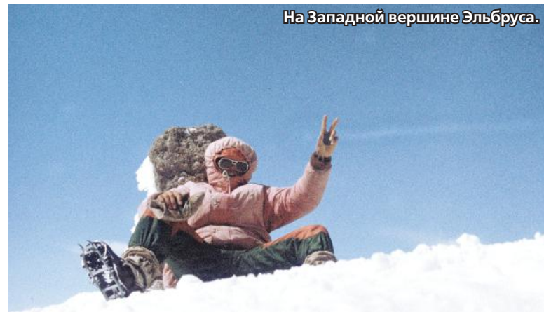
На Западной вершине Эльбруса.