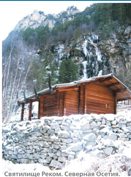
Святылище Реком. Северная Осетия.

Экскурсионное бюро «НИК», ул. 50 лет ВЛКСМ, 8/1, тел.: 60-80-72, 8-962-450-80-72.