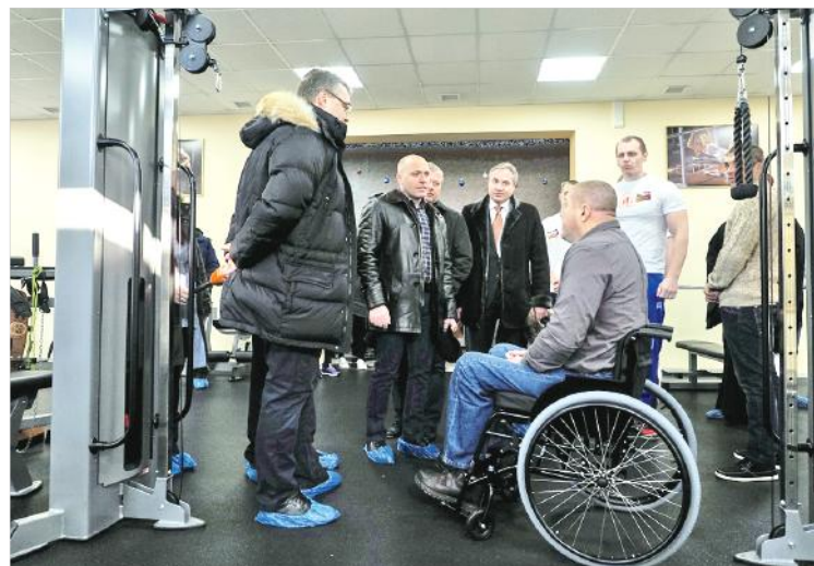
Люди с ограниченными физическими возможностями теперь могут заниматься физкультурой.