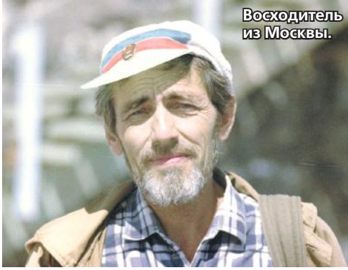
Восходитель из Москвы.