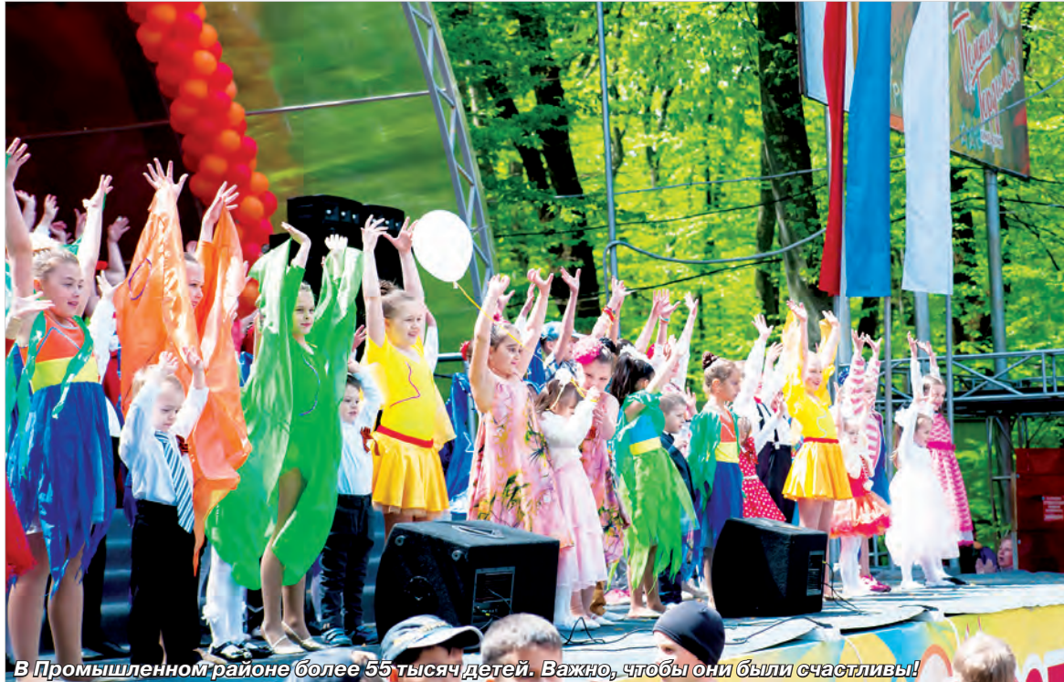
В Промышленном районе более 55 тысяч детей. Важно, чтобы они были счастливы!

– Мечтать, конечно, не вредно! Но если посмотреть на те же факты, то у нас в городе и районе, по сути, так и происходит. Только надо иметь в виду: если граждане обращаются в администрацию с просьбой установить ту же детскую площадку или спортивное оборудование во дворе своего дома, мы эту заявку ставим на учет и выполняем ее – при наличии средств. Но при этом говорим людям: поймите, что в современных условиях вам предстоит принять на себя обязанности по содержанию и ремонту этого оборудования в дальнейшем. Ведь вы же стали теперь прямыми пользователями этих благ! Такие отношения сегодня достигают своей цели – люди понимают проблему верно. Но есть случаи,