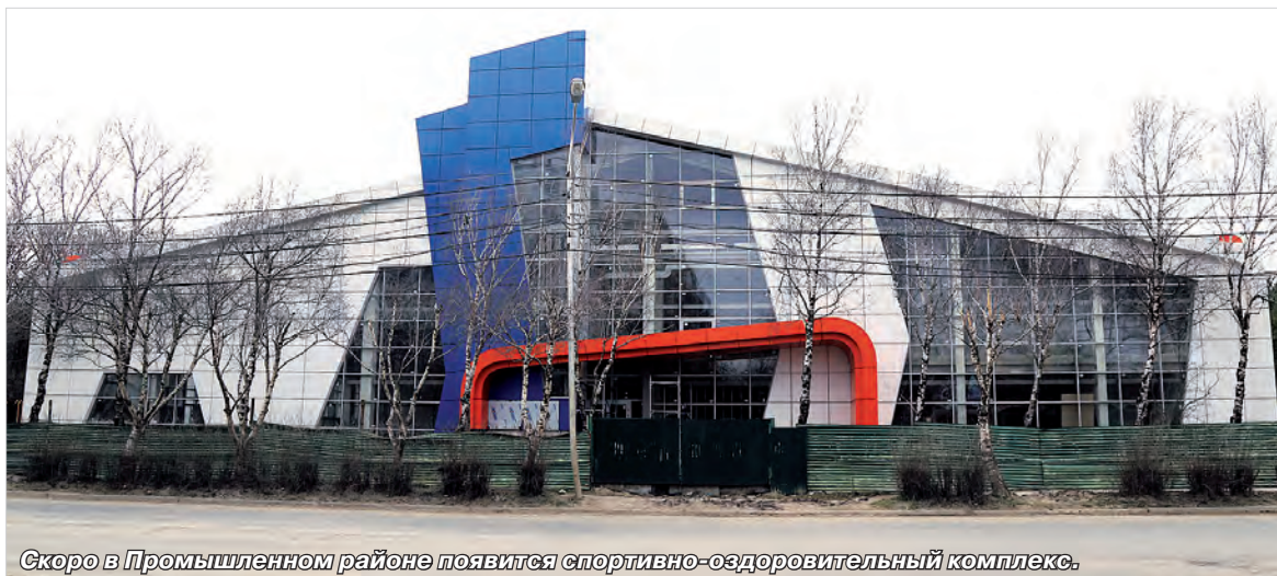
Скоро в Промышленном районе появится спортивно-оздоровительный комплекс.

когда к нам обращаются снова, и тогда приходится объяснять это еще раз.