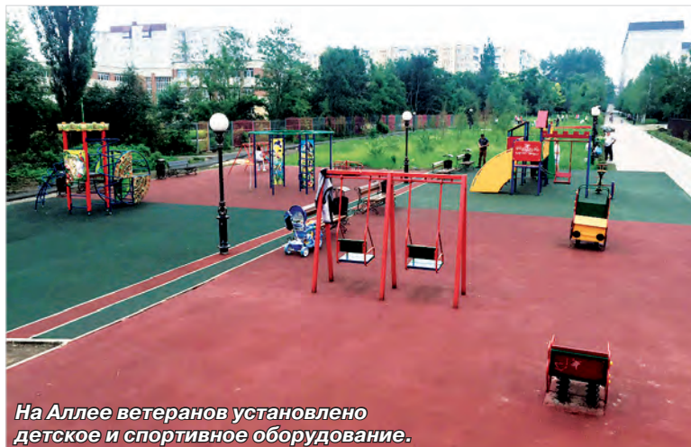
На Аллее ветеранов установлено детское и спортивное оборудование.