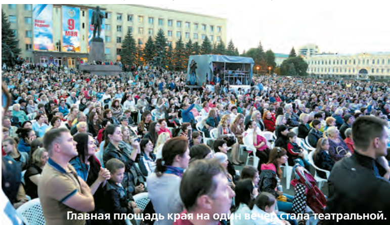
Главная площадь края на один вечер стала театральной.