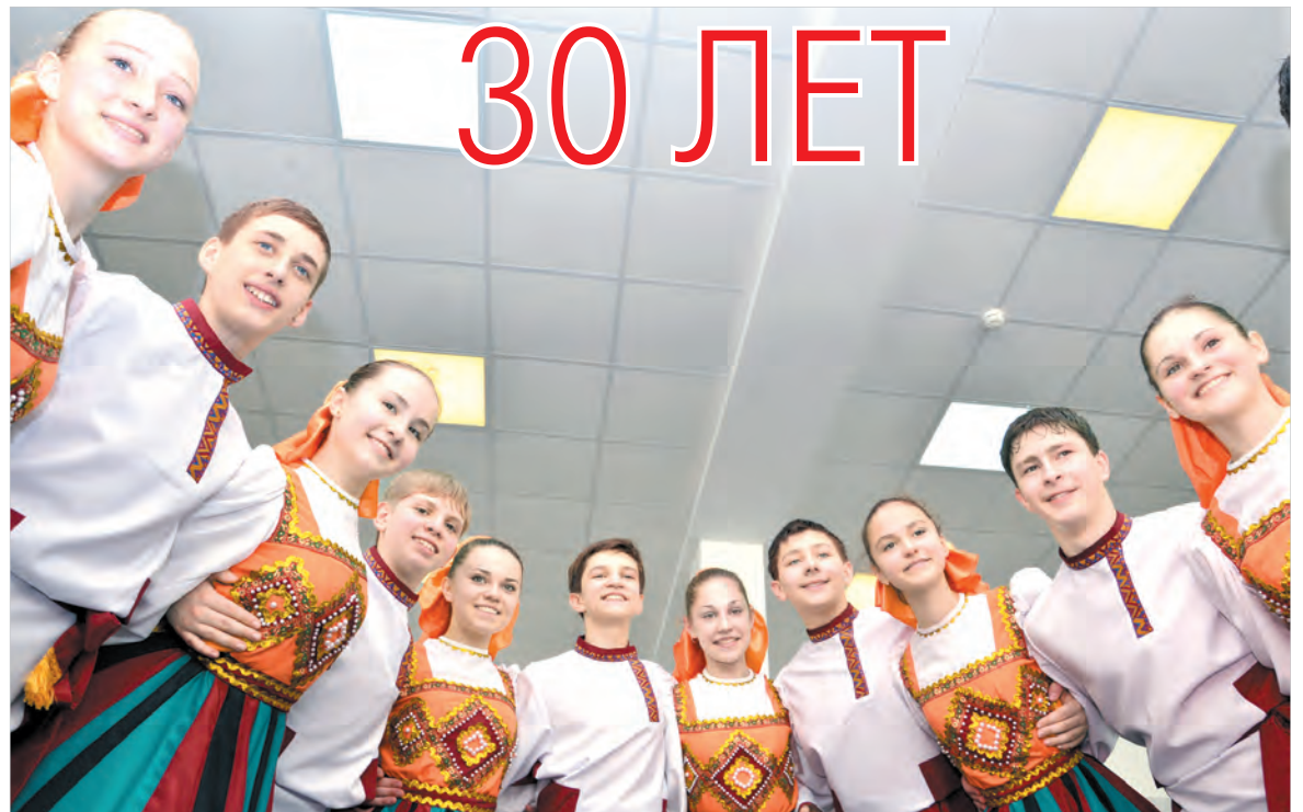
Озорной танец «Разгуляй».

краевого центра «Ставрополь – хранитель истории», созданный в 2012 году спектакль «В гостях у Терпсихоры», в котором участники коллектива продемонстрировали великолепное владение как народным, так и классическим танцем. И конечно же, концертные программы ансамбля «Радуга юных талантов».