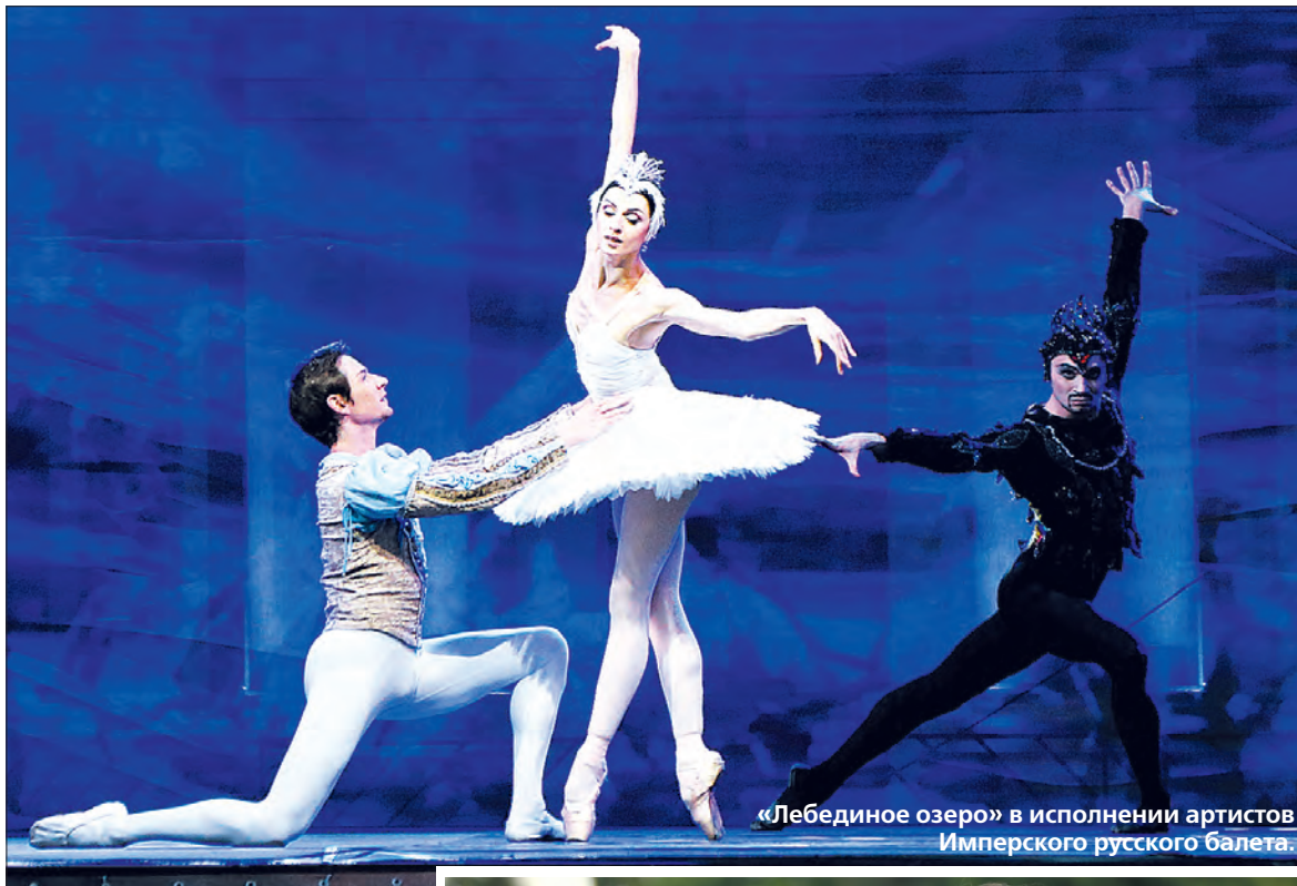
«Лебединое озеро» в исполнении артистов Имперского русского балета.

тившихся на город сумерках всё было похоже на чудо: изящные фигурки, словно парили в лучах прожекторов под гениальную музыку П.И. Чайковского.