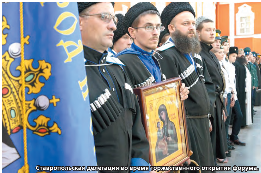
Ставропольская делегация во время торжественного открытия форума.

Под таким названием в Санкт-Петербурге прошел Первый Евразийский форум казачьей молодежи, который до этого четыре года подряд проводился в станице Темнолесской на Ставрополье.