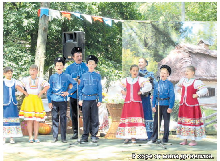
В хоре от мала до велика.