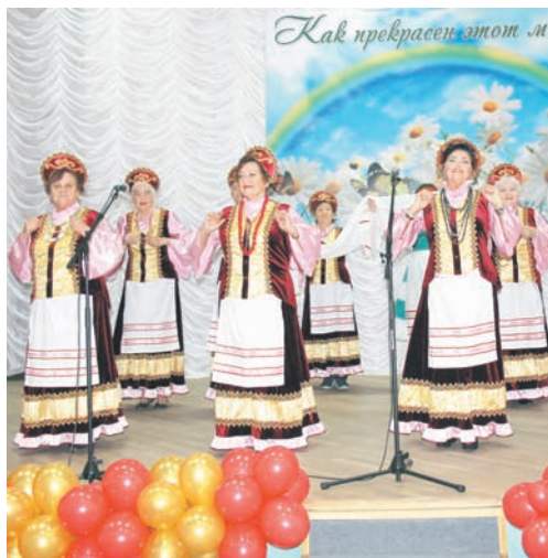
Участники объединения «Надежда» выступают в геронтологическом центре.