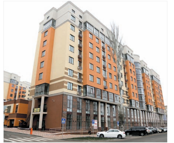
В современном жилье система видеонаблюдения проводится на стадии строительства.