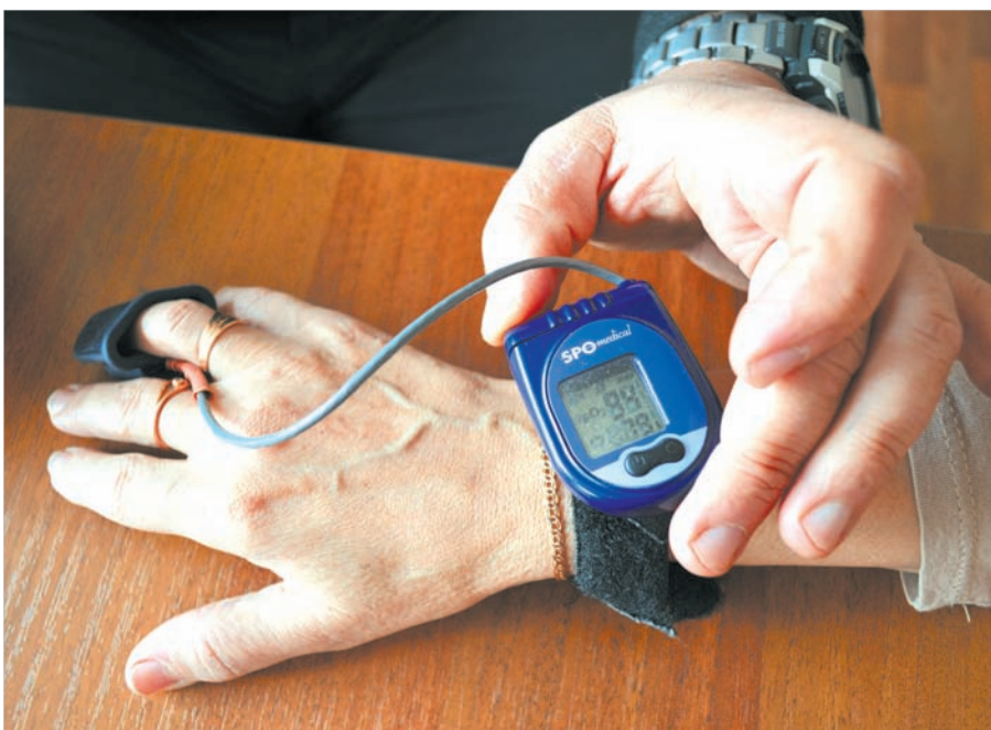
Сколько кислорода в крови?