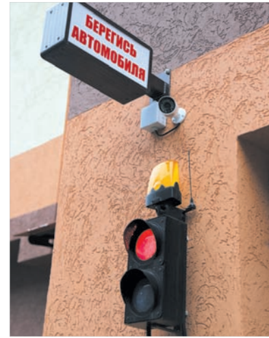
В Ставрополе системами видеонаблюдения пока оснащены 93 дома.