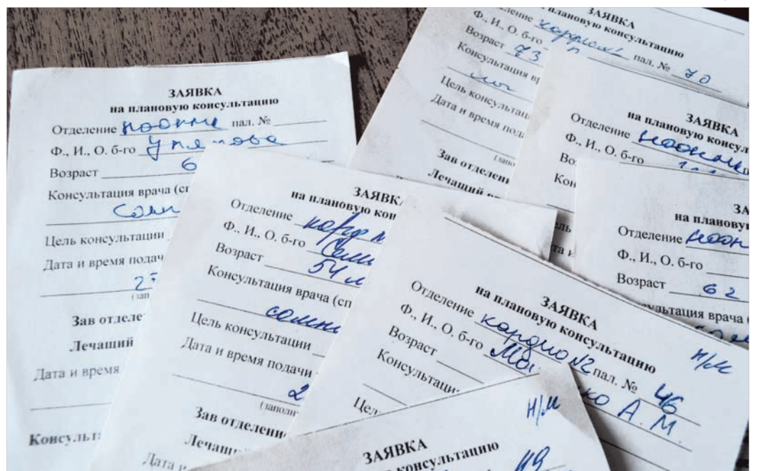
В сомнологический центр каждый день поступают заявки врачей на консультацию больных.