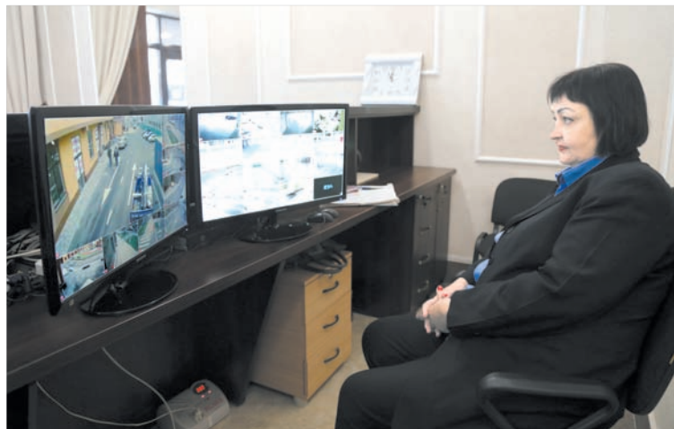
Сигнал со всех камер выводится на монитор. Оператор отслеживает всё в режиме онлайн.

Одна из составляющих АПК - это сеть видеонаблюдения, сеть экстренной связи и мониторинга, управление которой осуществляется централизованно через Ситуационный центр, Единую диспетчерскую службу. По сути это система безопасности, весьма эффективно выполняющая огромный спектр задач - от профилактики мелких правонарушений до предупреждения террористических актов. В 2012 году, когда началось плановое внедрение АПК в регионах страны, в Ставрополе уже семь лет, как работала целевая программа «Безопасный город». Она и стала основой для создания АПК. У нас уже были и Ситуационный центр, и ЕДС, и уникальный практический опыт работы, оказавшийся полезным для других регионов. Впоследствии этот опыт был замечен и отмечен на федеральном уровне. Но останавливаться на достигнутом и почивать на лаврах никто и не думал. Сфера обеспечения безопасности не может быть статичной, она должна развиваться. И она развивается.