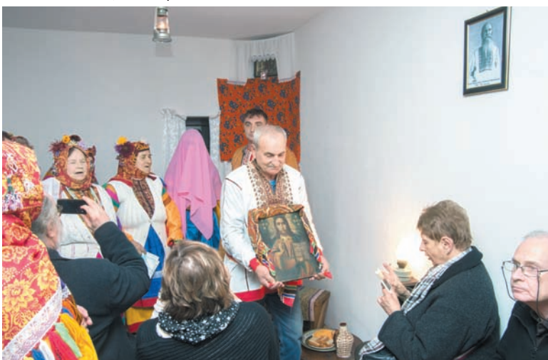
Некрасовцы показывают ученым фрагмент свадебного обряда.

Ольга МЕТЕЛКИНА.