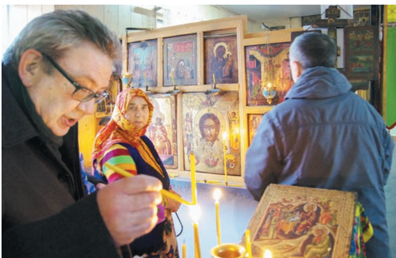
В старообрядческом храме.