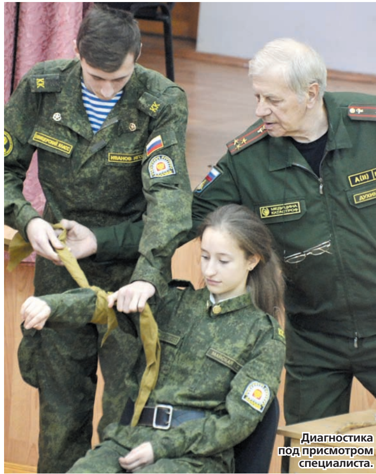
Диагностика под присмотром специалиста.

Условно пострадавшим незамедлительно проводилась диагностика, оказывалась первая помощь. Быстрота действий, слаженная и уверенная работа кадет на учениях сейчас - возможно, чья-то спасенная жизнь в будущем! Всегда спокойнее, когда рядом есть люди, которые в стрессовой ситуации поступят правильно - «как учили». Учения завершились, а навыки останутся, к тому же, возможно, эти встречи помогут ермоловцам в выборе профессии.