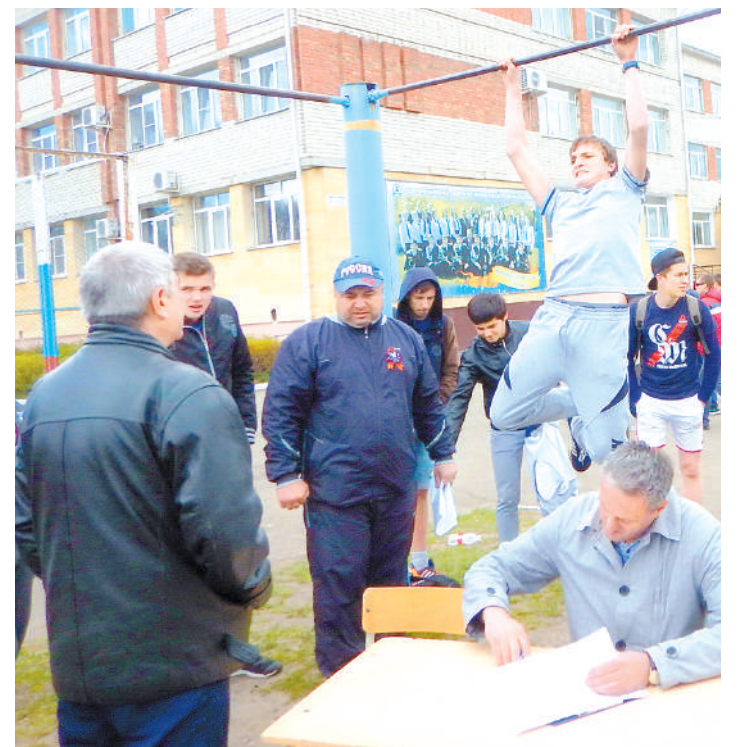
Подтягивание на перекладине.

По общим итогам Спартакиады среди учащихся среднего и старшего возраста третьими стали кадеты-ермоловцы, вторыми - ребята из Благодарненского района и первое место у команды гимназии № 24 имени генерал-лейтенанта юстиции М.Г. Ядрова.