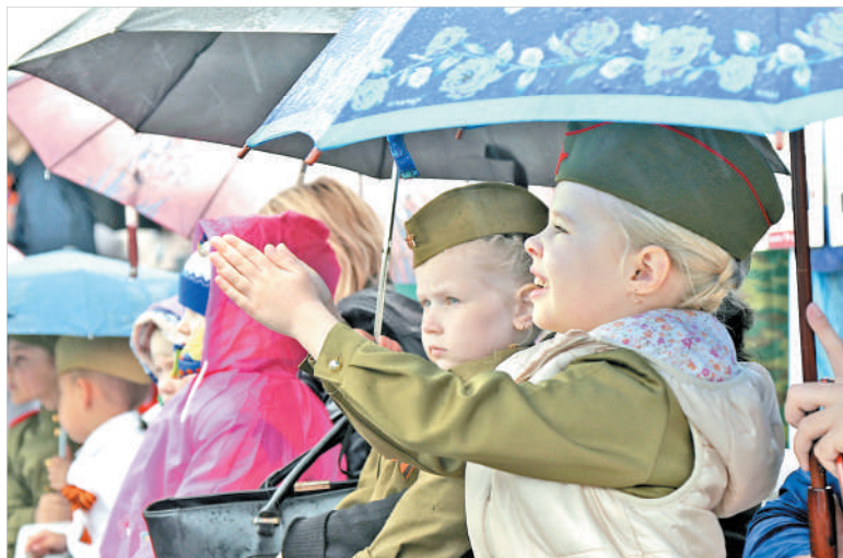
Правнукам победителей дождь не страшен.