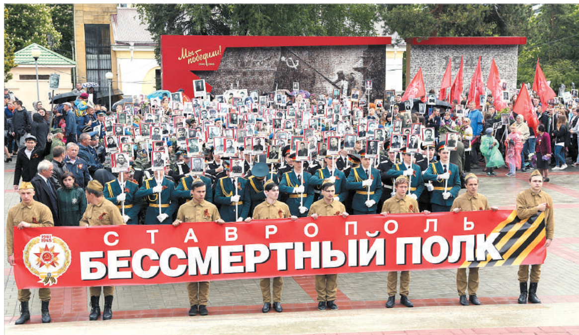
В шествии Бессмертного полка приняли участие более 15 тысяч человек.