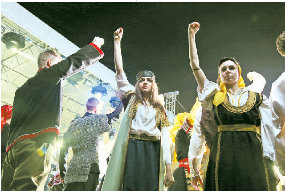
Сцена из спектакля «Белые журавли». Единство славянских народов.