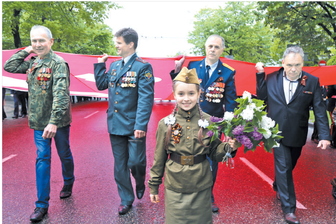
Знамя Победы — гордость всех поколений.

Да, военный парад — это зрелище. Далеко не везде можно увидеть его воочию. Ставрополь входит в число 28 городов России, проводящих военные парады. Все воинские части Ставропольского гарнизона, лучшие образцы военной техники. Парадным строем прошли солдаты и матросы Великой Отечественной (военнослужащие 247-го десантно-штурмового полка в форме тех времен) и военнослужащие частей и соединений, обеспечивающие безопасность России как в районе постоянной дислокации, так и на