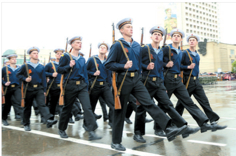
В форме моряков — десантники 247-го гвардейского полка.