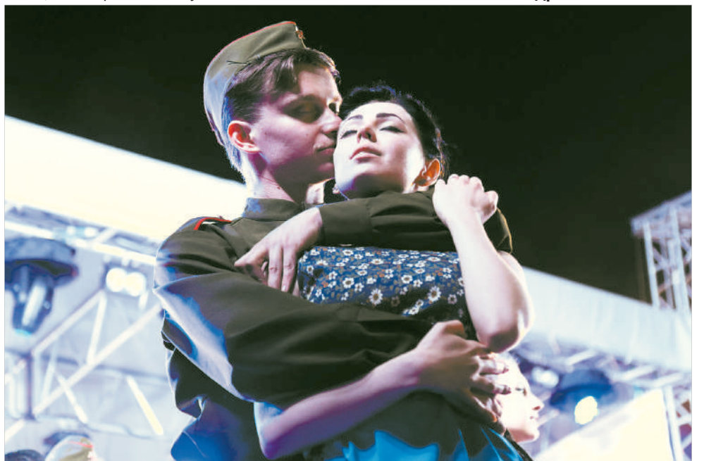
Все побеждает любовь.