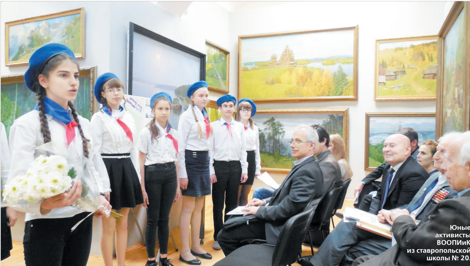
Юные активисты ВООПИиК из ставропольской школы № 20.