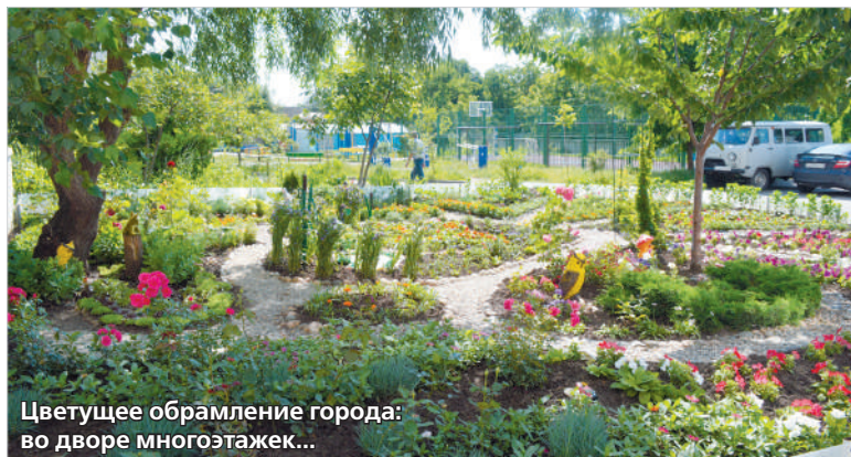
Цветущее обрамление города: во дворе многоэтажек...

После затяжных дождей выглянуло солнце – долгожданное, теплое. На солнечные лучи откликнулась природа. Кусты роз покрылись бутонами, расцвели клематисы, вот-вот распустятся яркие свечки элегантных красавцев дельфиниумов. А значит, пора открывать новый сезон нашего традиционного проекта – «Город – цветущий сад».