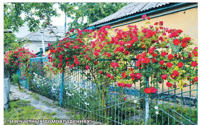
...и в частных домовладениях.

Приглашаем поучаствовать в проекте всех, кому надоело видеть унылые дворы, серые фасады многоэтажек.