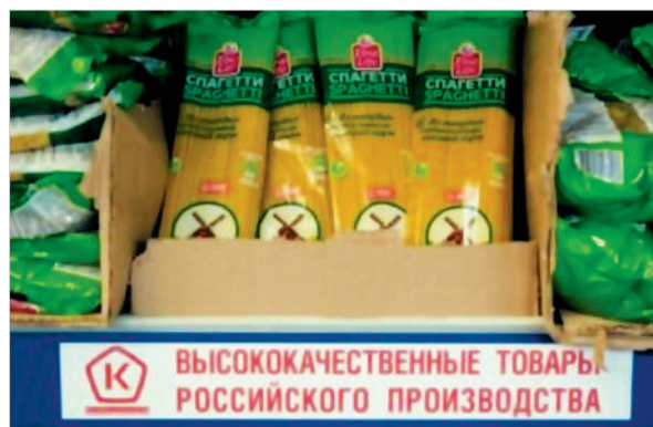
Спецвитрины для товаров, отмеченных Знаком качества.

И теперь для обладателей Знака качества включат «зеленый свет» на пути к покупателю. Программой предусмотрено проведение уникальных промо-мероприятий в торговле. В магазинах разных форматов, поддержавших государственный проект, уже появились дополнительно в торговых залах специальные зоны, на витринах которых выделены товары, отмеченные Знаком качества. Надеемся, что к этой программе присоединятся и торговые предприятия Ставрополя. Сегодня в разных уголках страны активно продвигаются рыбная и масло-жировая продукция, шампанское, крупы, товары для дома, детская одежда и обувь с узнава-