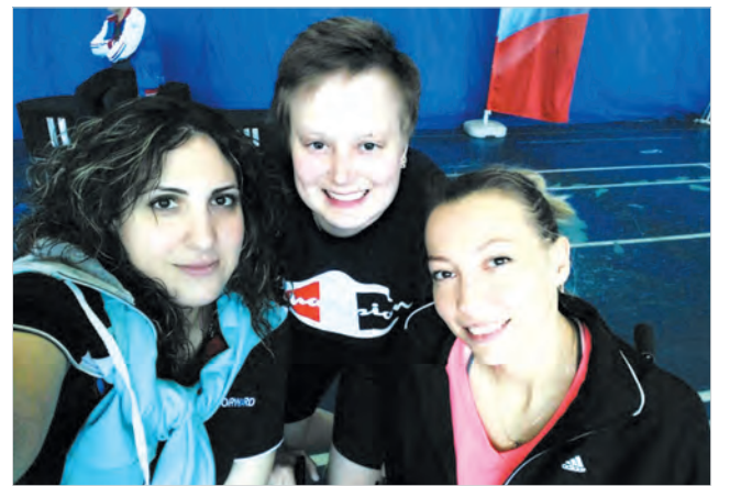
Ставропольские бадминтонистки со своим тренером.