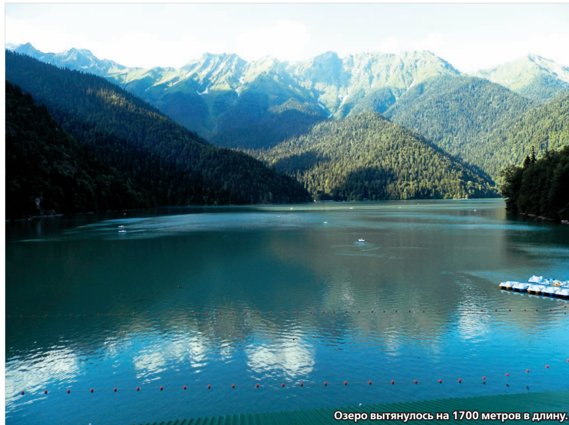
Озеро вытянулось на 1700 метров в длину.

Визитная карточка Абхазии – горное озеро Рица. Не побывать здесь, если вы приехали даже исключительно для пляжного отдыха, считается просто дурным тоном. Однако нужно быть готовым к сложной, а местами опасной дороге, которая поднимается от нуля до 950 метров над уровнем моря по склонам Гагрского хребта.