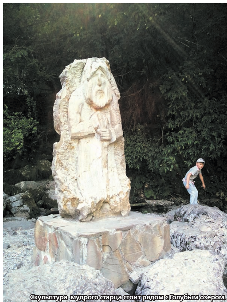
Скульптура мудрого старца стоит рядом с Голубым озером.

Затем дорога сворачивает к притоку реки Бзыбь – реке Гега, а потом уже к притоку Геги – Юп-