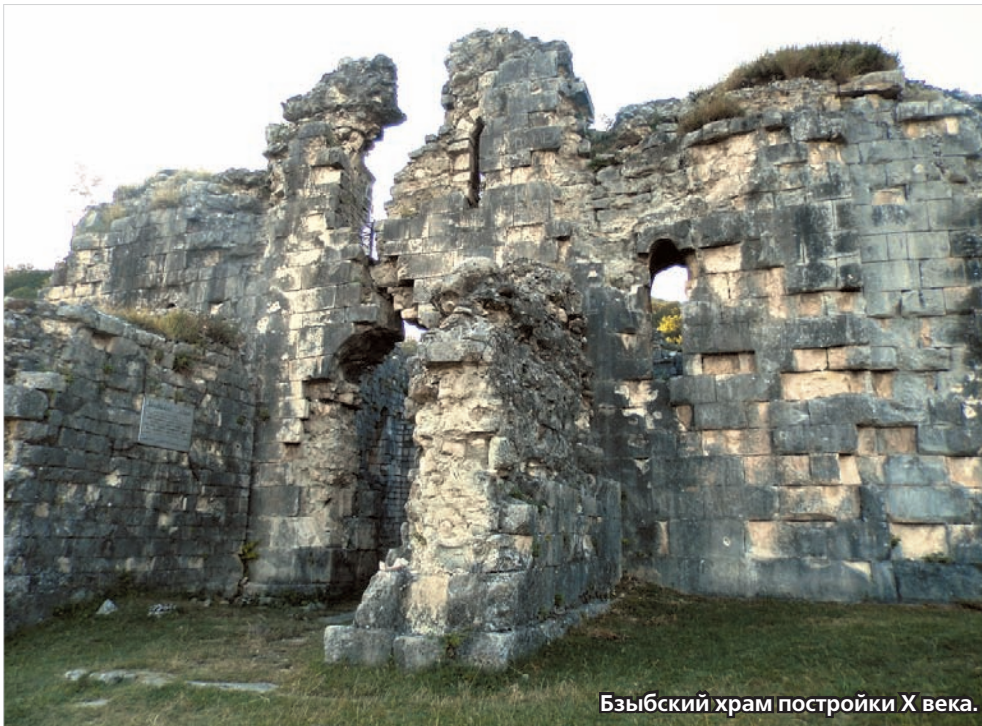
Бзыбский храм постройки X века.