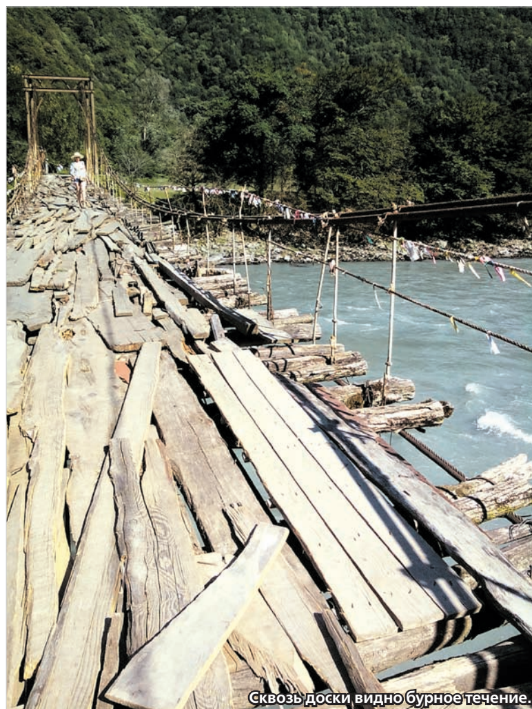
Сквозь доски видно бурное течение.