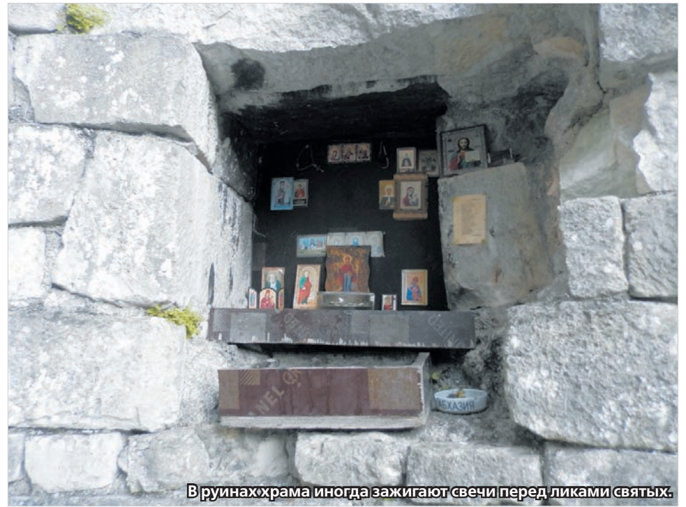
В руинах храма иногда зажигают свечи перед ликами святых.

шаре (Юпсаре) – единственной вытекающей из озера Рица реки, и проходит по дну бесподобного Юпшарского каньона, который заканчивается Юпшарскими воротами. Каньон образовался много лет назад в результате землетрясения, сегодня многие называют его «каменным мешком». Действительно, скалы, при высоте до 400 метров, иногда почти соприкасаются своими вершинами. Из-за этого солнце заглядывает сюда редко, и после жаркого побережья каньон дышит свежестью и прохладой. Кстати, горы совсем не голые – они увиты растительностью, выходящей по склонам.