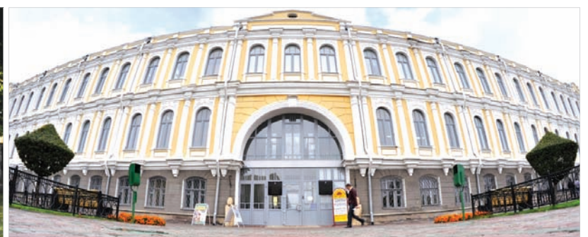
Ставропольский государственный музей-заповедник - популярное место.