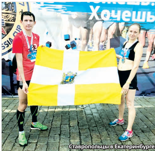
Ставропольцы в Екатеринбурге.

Ставрополь на данных соревнованиях представляли три бегуна, выступавших на дистанции 21,1 км (полу-