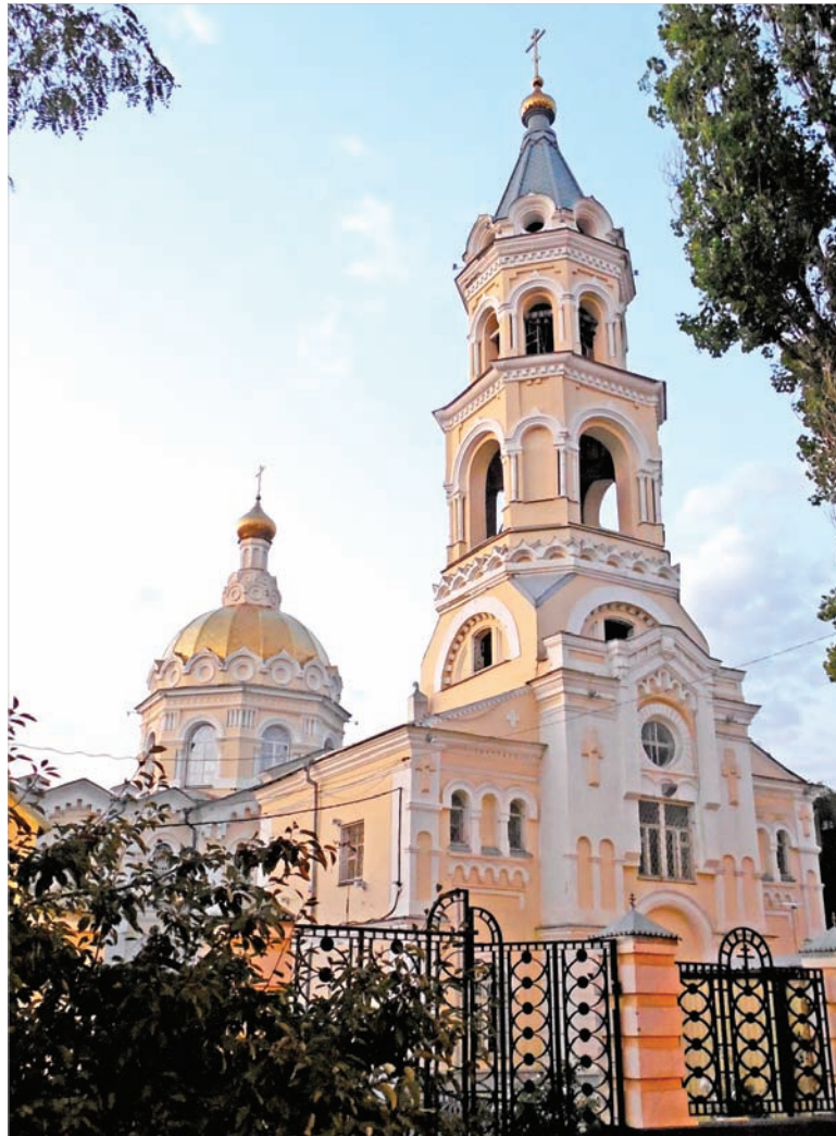
Андреевский собор в Ставрополе - свидетель многих важных исторических событий.

Так исторически сложилось, что захлестнувшая множество российских городов в 90-е годы про-