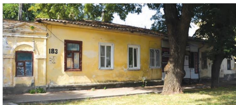
Дом на улице Дзержинского, 183, в котором нередко бывал Михаил Юрьевич Лермонтов.