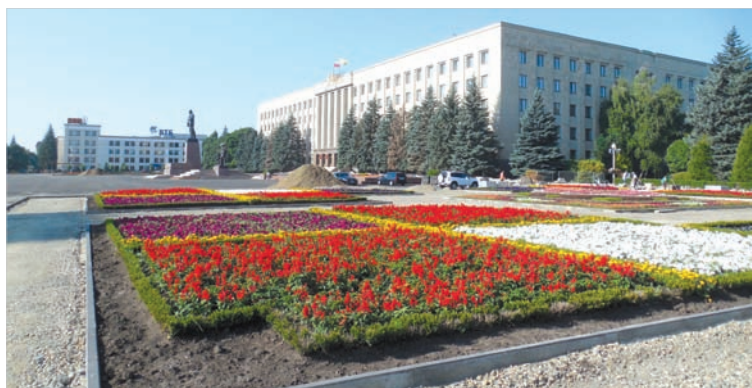
Площадь Ленина преобразуется к празднованию 240-летия Ставрополя.

Несмотря на то, что Ставрополь не входит в число самых популярных туристических центров России, мы-то знаем, что в нашем городе есть на что посмотреть, есть чем удивить приезжих. Особенно в преддверии празднования 240-летия с момента его основания. Наиболее популярные экскурсионные маршруты по городу, как правило, связаны с Крепостной горой. Это то самое место, где по плану, утвержденному князем Г.А.