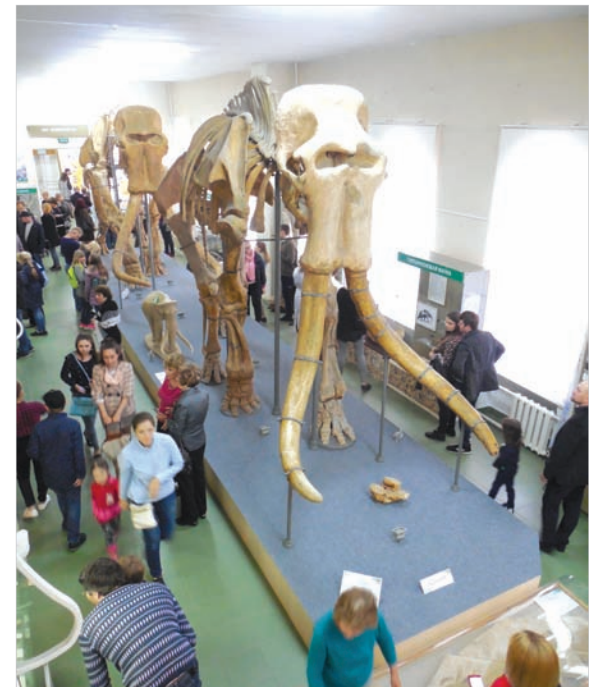
Парочка южных слонов в отделе природы музея-заповедника всегда в центре внимания.

Александра ГОЛОЛОВОВА, Елены БАРАБАШОВОЙ.