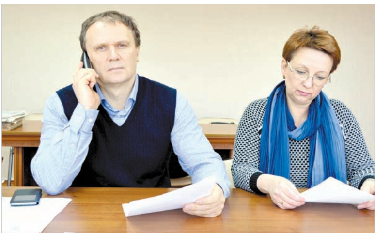
Главный онколог края Виталий Шутов и главный радиолог Северо-Кавказского федерального округа Владислава Бумагина.

В минувшую среду редакция «Вечернего Ставрополя» провела традиционную «прямую линию», приуроченную ко Всемирному дню борьбы с раковыми заболеваниями. На вопросы читателей отвечали главный внештатный онколог минздрава края Виталий Шутов и главный внештатный радиолог Северо-Кавказского федерального округа Владислава Бумагина. Обращения были разные. Отметим: впервые наши читатели не поднимали проблем лекарственного обеспечения онкобольных, записи на прием к врачу, что непременно звучало на предыдущих «прямых линиях». А значит, в этих вопросах произошли положительные изменения, что, конечно же, радует. В соответствии с действующим законодательством и по этическим соображениям мы не называем фамилии и имена звонивших.