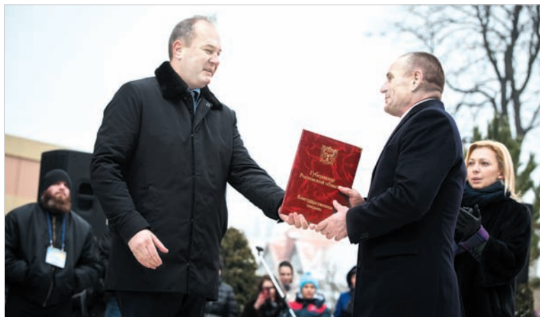
Начало на 1-й стр.