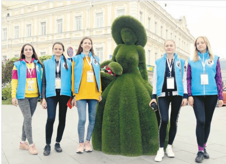
В программе фестиваля эти девушки из Курска предстанут в сказочных образах.

По другую сторону главной площади «Города мастеров» были развернуты национальные подворья, где национально-культурные общества, города и районы края пос-