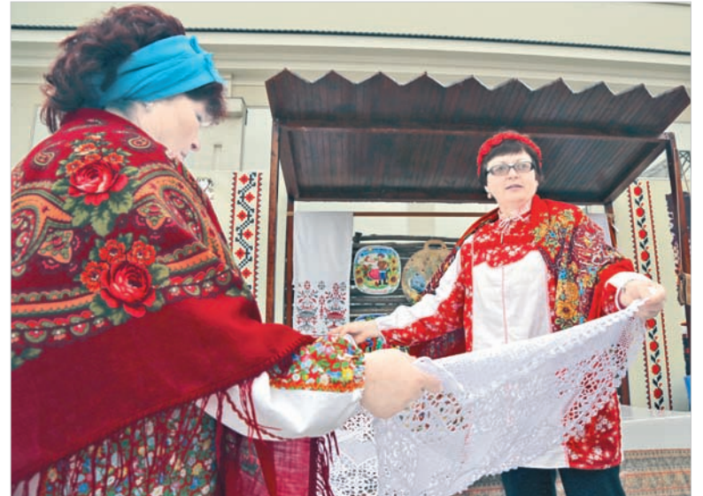
Шали и витражную роспись на тарелках представляет Изобильненский район.

У абазин было много интересных обрядов. Например – «открывания рта». Оказывается, когда в абазинской семье женился сын, невестке первое время нельзя было входить на половину родителей и разговаривать с ними. Лишь через полгода она могла «открыть рот». По этому