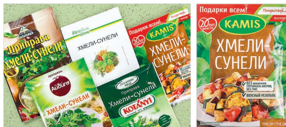
На стол экспертов попали пять образцов известной приправы.

На стол экспертов попали пять образцов известной приправы. Эта приправа — вообще не хмели-сунели.