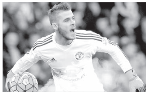
В игре Давид Де Хеа.

При этом, исповедуя ярко выраженный атакующий стиль, испанцы и пропускают не много — в 10 матчах три гола. Понятно, что залогом этого блестящего сыгранности и взаимозаменяемости футболистов высокого класса. Но все-таки главным оплотом обороны является Давид Де Хеа — лучший вратарь Европы, а по мнению некоторых — и мира!