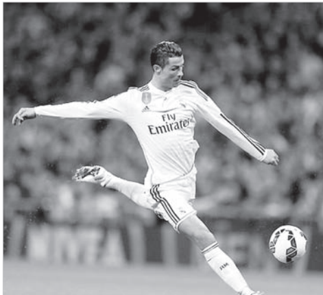
В атаке капитан сборной Португалии Кристиану Роналдо.

При всей стабильности и организованности сборная Португалии все-таки сильно зависит от присутствия в ее составе лучшего игрока Европы последних лет Кристиану Роналдо. Он и безоговорочный лидер, и лучший бомбардир, хотя в раздевалке, скажем, авторитет Бруну Алвеша, Пепе, Бернарду Силвы или Руй Патрисиу даже выше. Но вряд ли имеются веские основания утверждать, что у португальцев не все в порядке с моральным климатом — Фернанду Сантуш умело лавирует между своими «звездами» и рабочими лошадками и твердо держит бразды правления в своих руках.