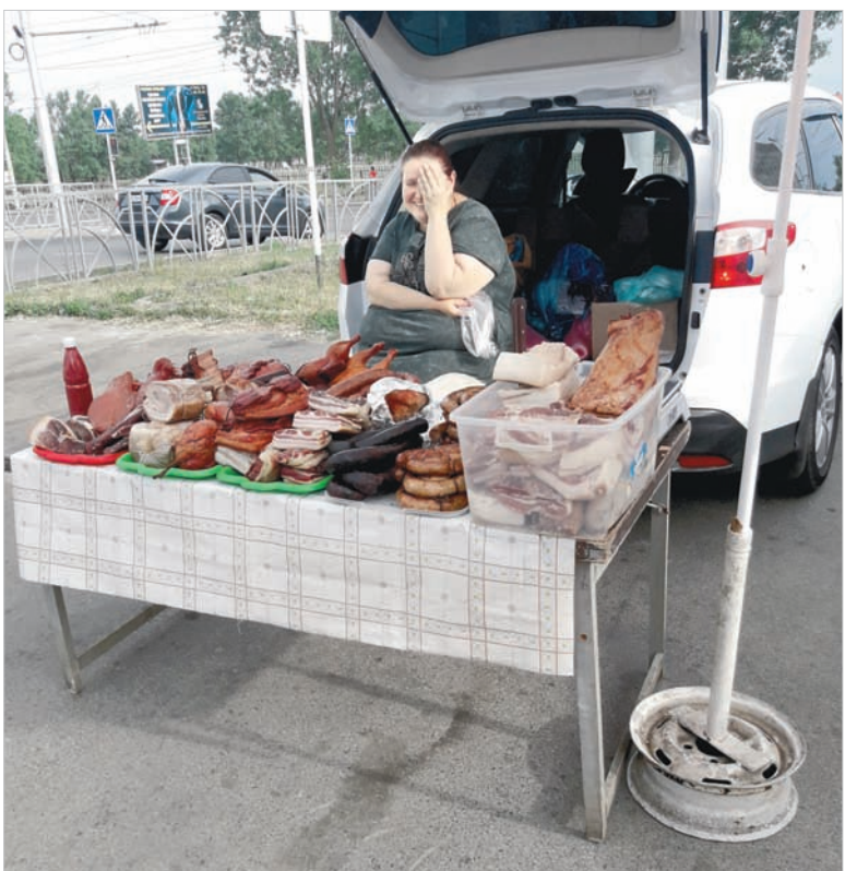
Вот так выглядит обычный «стихийный» прилавок.