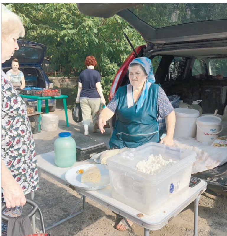
Молочные продукты продаются под палящим солнцем.

Ежедневно в Ставрополе три рейдовых бригады выходят на улицы города, чтобы остановить стихийную торговлю продуктами. Эту работу специалисты комитета муниципального заказа и торговли городской администрации проводят вместе с районными властями и правоохранительными органами. Но очистить улицы от «стихийщины» не удастся, пока ее поощряют своими покупками жители Ставрополя, не задумываясь о том, что продукты на уличных прилавках могут нести опасность.