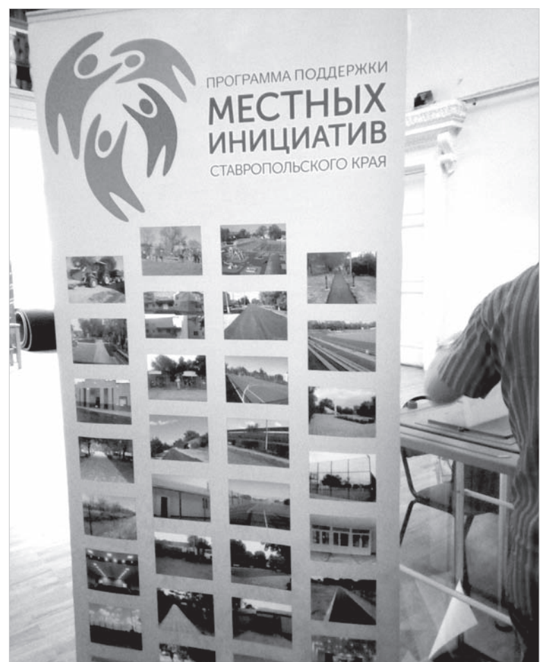
Вся информация о программе «Местные инициативы» — на стендах.