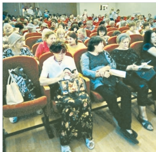
В зале собралось много людей, желающих отдать свой голос за ту или иную территорию.