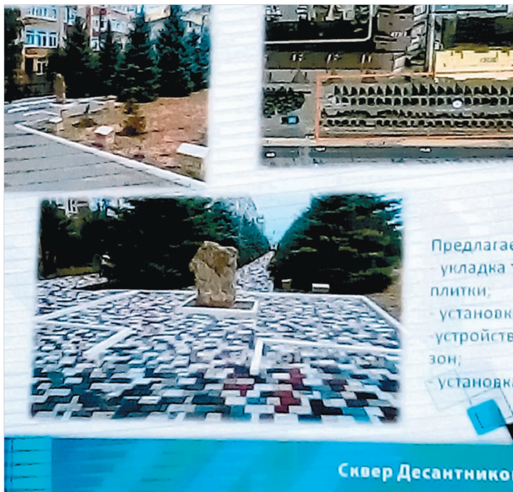
Каждый проект представили на большом экране.

Итак, расскажем о каждом из них: первый проект предполагает благоустройство аллеи Героев-десантников на улице Серова, в районе дома №472. Здесь планируется ук-