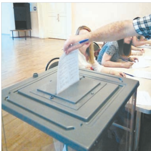
Заполненный лист для голосования опускали в прозрачную урну.