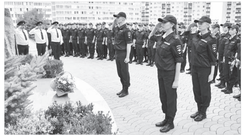
Курсанты почтили память погибших сотрудников органов внутренних дел.

С началом учебного года личный состав поздравили почётные гости: федеральный инспектор по Ставропольскому краю аппарата полномочного представителя Президента Российской Федерации в Северо-Кавказском федеральном округе Юрий Бочаров, член комитета Думы Ставропольского края по казачеству, безопасности, межпарламентским связям и общественным