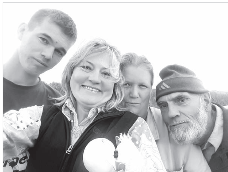
Те, к кому добиралась, крайний справа – папа.