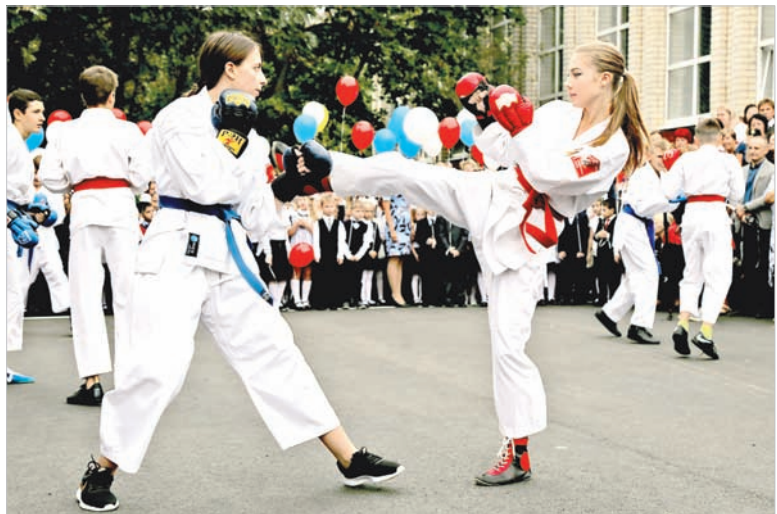
Спортсмены показывают первоклашкам чудеса тхэквондо.

Лариса РАКИТЯНСКАЯ.