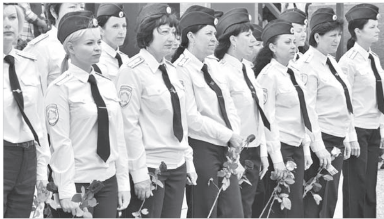
1 сентября торжественно встретили в Ставропольском филиале Краснодарского университета МВД.

Торжественное построение завершилось маршем по плацу филиала под звуки духового оркестра.