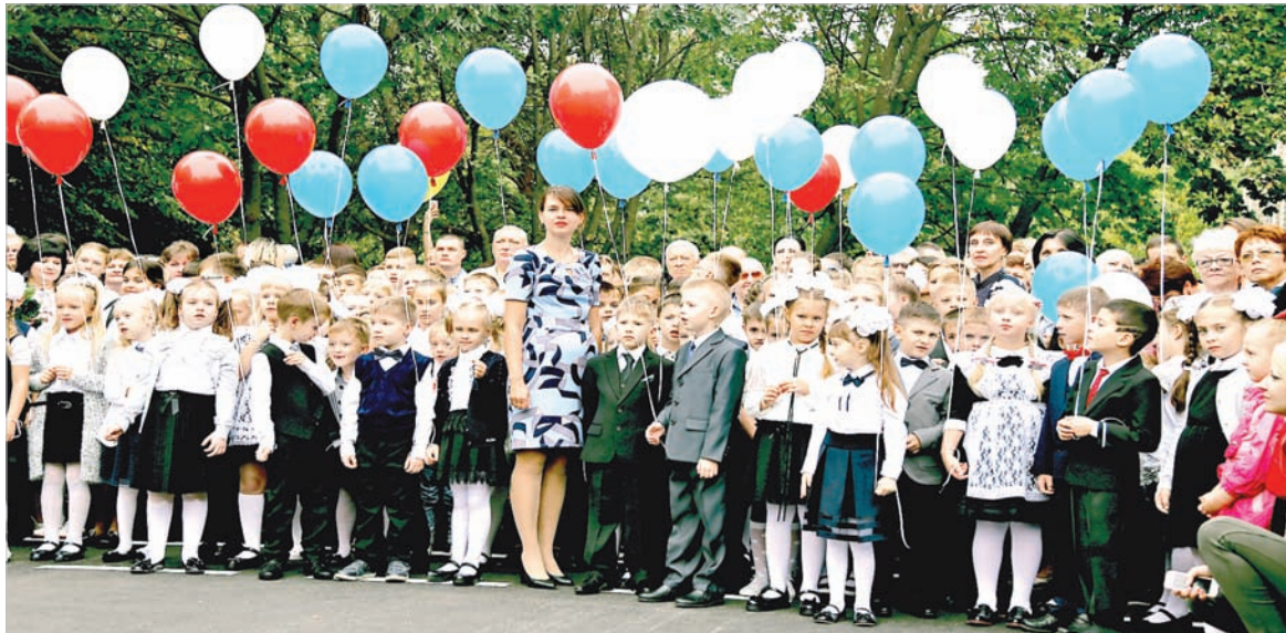
26-я школа: первый раз в первый класс...

- Все мы ждем 1 сентября, это классный день. Наши главные виновники торжества - конечно, первоклассники. Они смотрят на все вокруг и думают с удивлением: куда мы попали? Но, наверное, более глубоко раздумья сегодня у старшеклассников - этот учебный год у них решающий: впереди экзамены и то самое время, когда надо выбрать свой жизненный