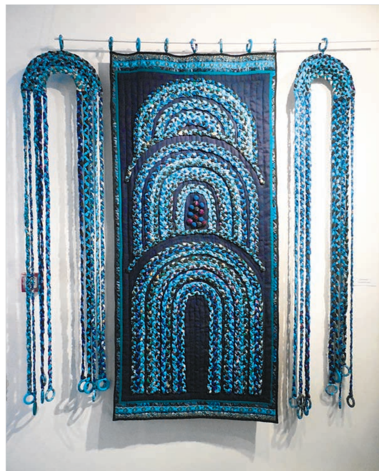
Панно «Бахчисарайский фонтан» Евгении Васильевой.