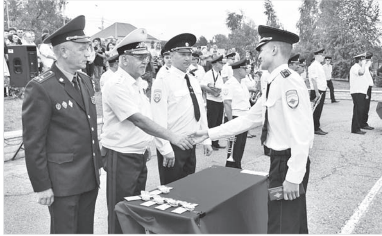
Пятикурсники получили свои первые офицерские звания.