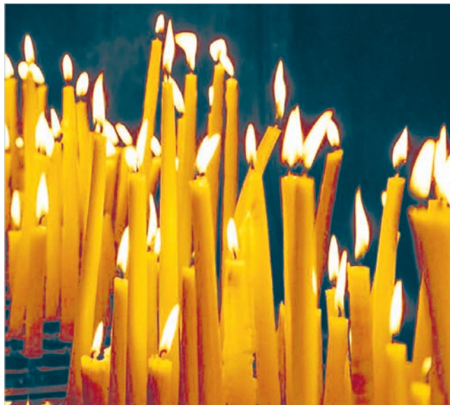
Горят поминальные свечи.

100 лет назад 24 января 1919 года было принято секретное постановление Организационного бюро ВЦИК РКП (б) «Циркулярное письмо об отношении к казакам».