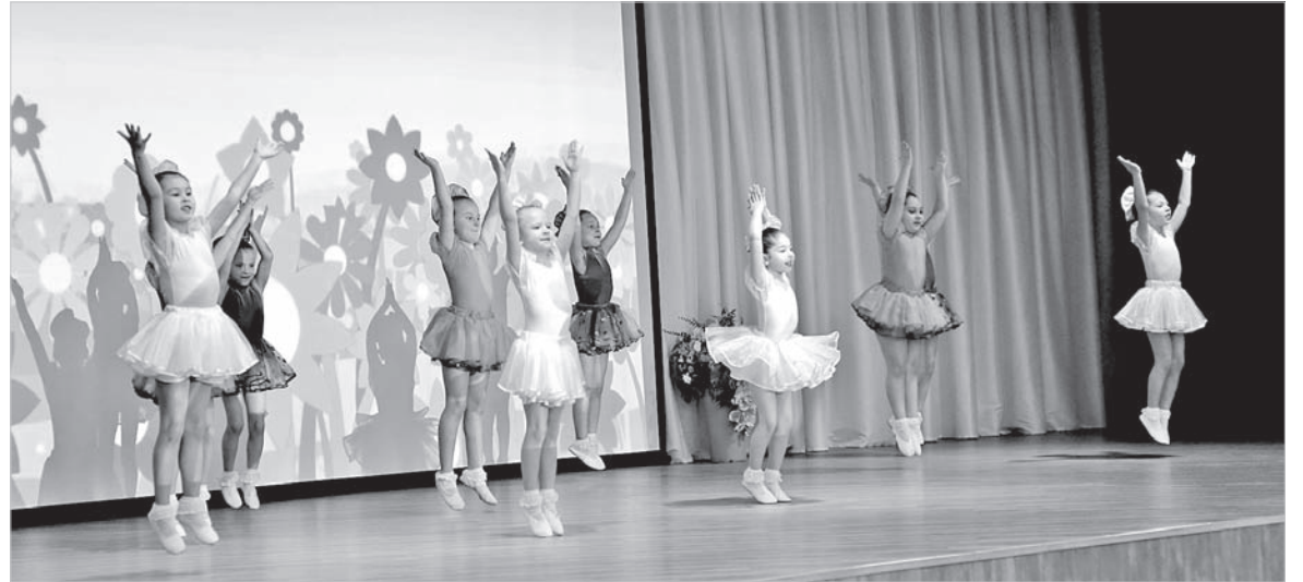
Веселым танцем поздравляем любимых педагогов.