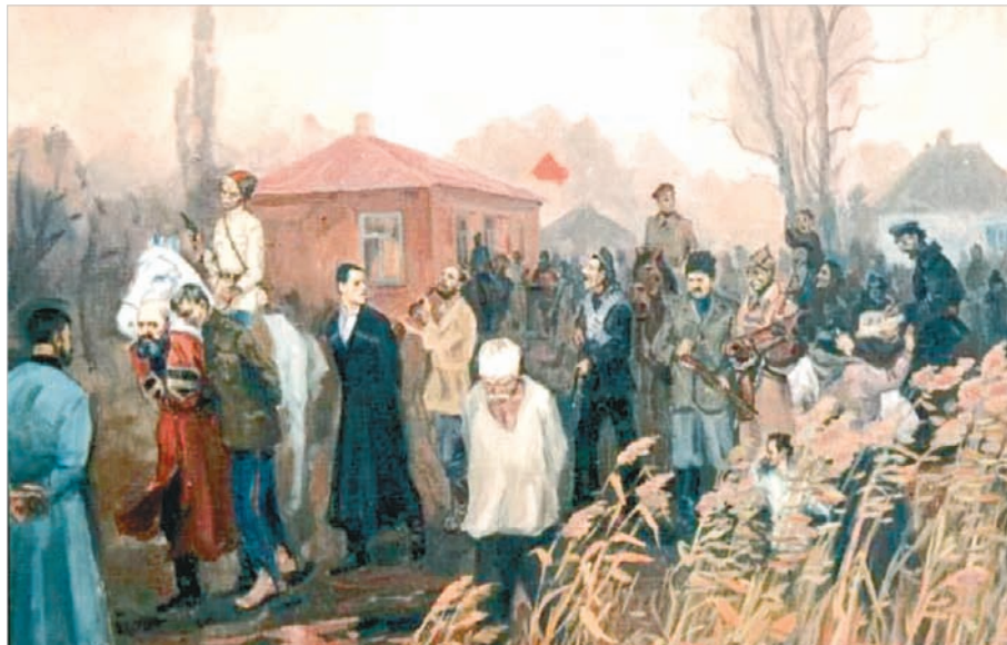
Будут казаков на казнь.

«Да, мы были противниками, но очень странными. У нас была одна любовь, но не одинокая... И мы, как Янус или как двуглавый орёл, смотрели в разные стороны, в то время как сердце билось одно». А.И. Герцен