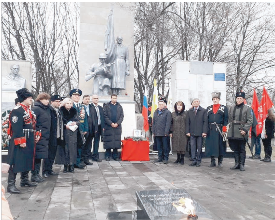
Участники митинга в память о советском офицере.