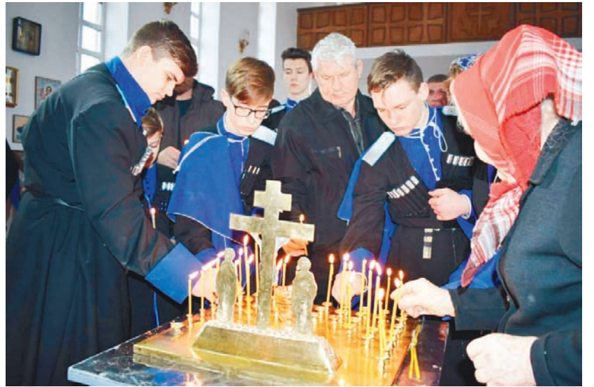
Горят поминальные свечи.

Казак различных возрастов трех населенных пунктов Нефтекумского районного казачьего общества собрались на богослужение в храме