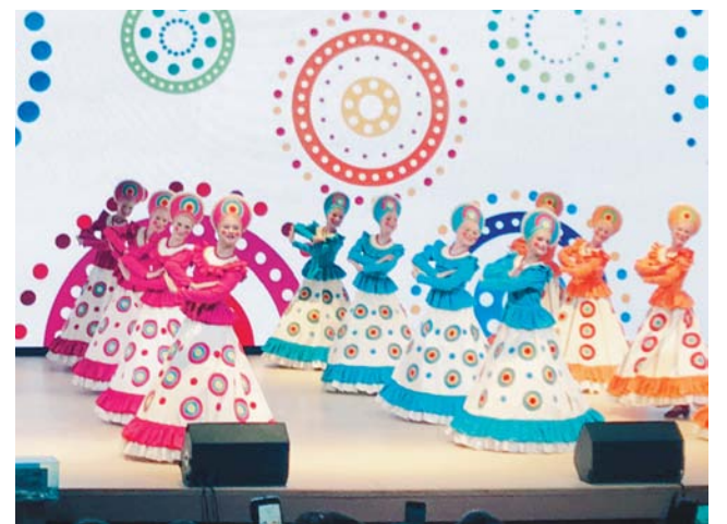
На сцене ансамбль «Радуга».

На сцене городского Дворца детского творчества зрители увидели выступления замечательных творческих коллективов нашего города. Это образцовый ансамбль кавказского танца «Сихарули» Центра развития творчества детей и юношества имени Ю.А. Гагарина, образцовый детский коллектив - студия спортивного бального танца «Меридиан» Дворца детского творчества, учебные ансамбли и образцовый ансамбль танца