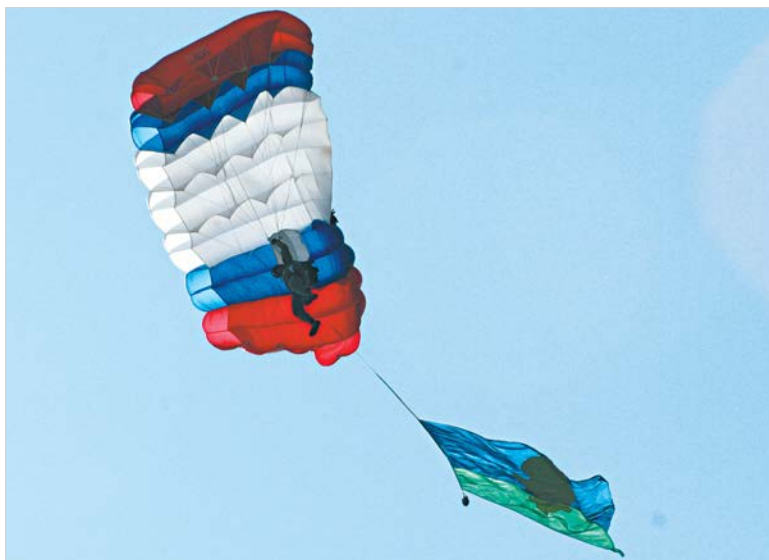
А теперь нашлась нам в небе работа – синевую наполнять парашюты.