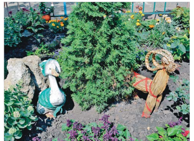
Садовый декор — своими руками.