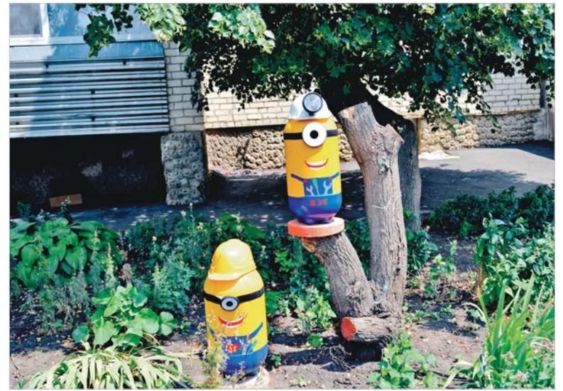
Мультяшные миньоны в палисаднике — на радость детворе.