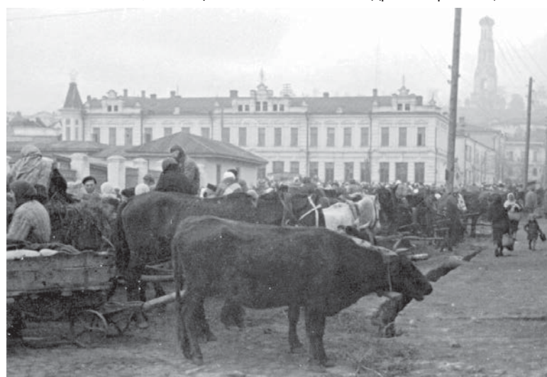
Нижний рынок осенью 1942 года.