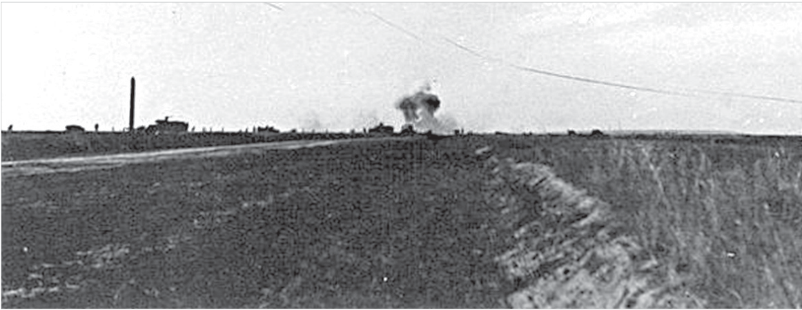
Наступление (ставропольское направление), 1942 год.

Украины, преданные Родине активисты и просто мирные граждане, попавшие под авиаудары. В этот трагический день «Вечерний Ставрополь», опираясь на научные и исторические источники, вспоминает, что творилось в городе, когда по улицам проехали первые танки с крестами.