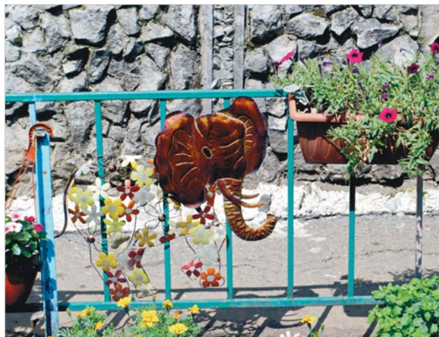
Ограда тоже должна быть красивой.