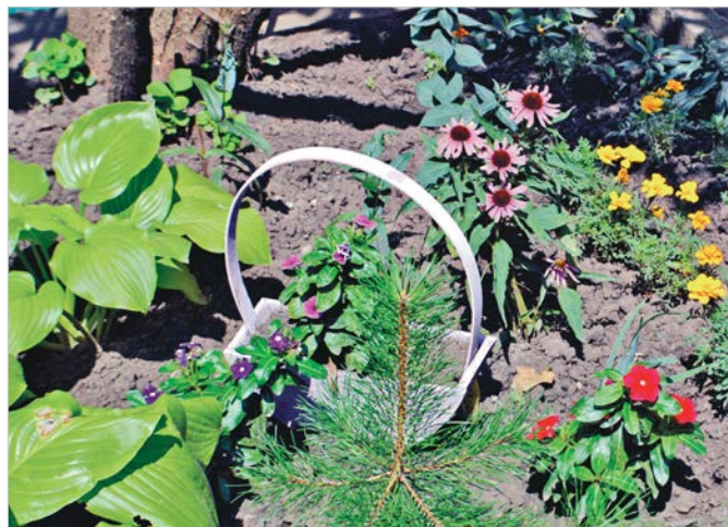
Рукотворные корзинки для цветов.