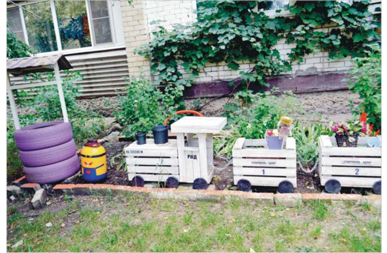
... и ее сказочный подарок.