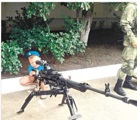
Интересно заглянуть в прицел настоящего орудия.