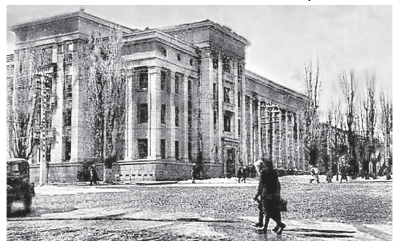
Сгоревшее здание НКВД (на время оккупации здание заняли немецкие службы безопасности) на углу улицы Дзержинского и проспекта Октябрьской революции, 1943 год.