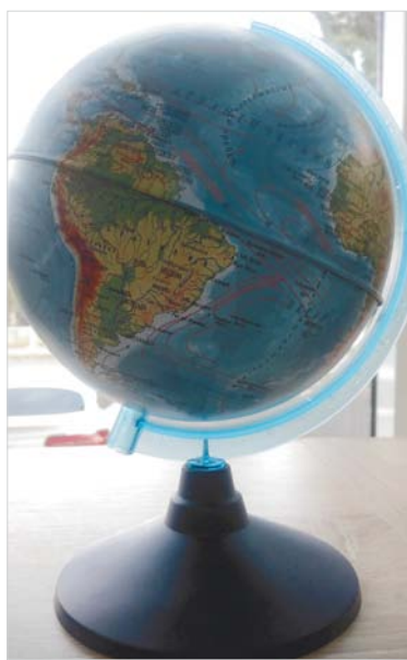
Этот маленький глобус продается в продуктовом магазине за 490 рублей.

А вот почему к изготовлению школьной формы привлекаются наши швейные фабрики? Ответ прост: они – профессионалы, и знают, какая ткань более практична, гигиенична. А какое преимущество дает индивидуальный пошив, объяснять, думаю, не надо! Ведь когда мы что-то покупаем в магазине, порой приходится переламывать. Это дополнительные затраты. Рынок услуг велик, но товары местных производителей дешевле! Школьную форму можно