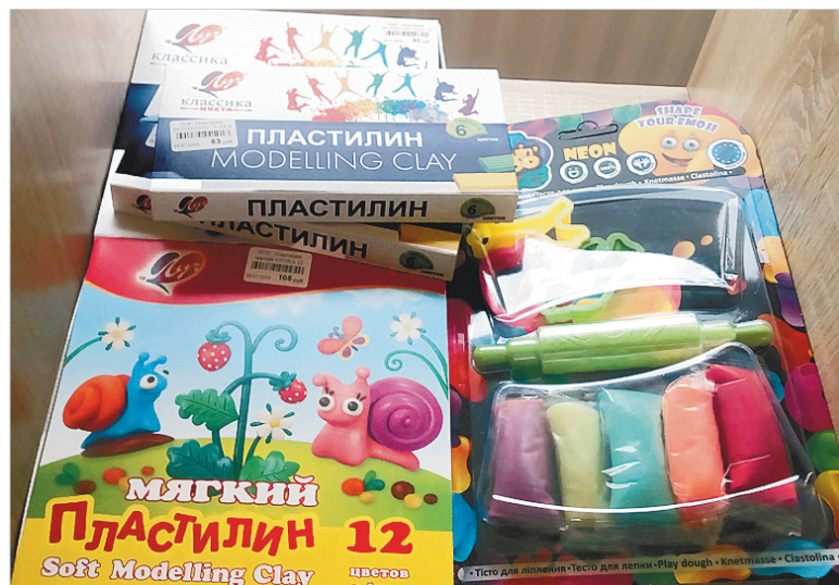
Пластилин. Цена от 63 до 105 рублей.