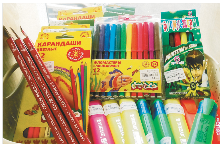
Цветные карандаши тоже можно купить по разной цене...

Да, сейчас цены всюду по стране стали выше: в среднем брюки для первоклашки – 1200, пиджак – 2100, жилет – 900. Но все приведенные выше цифры – лишь примерные. Эти же ценовые «коридорчики» изменились и в школьной форме для девочек. Например, в 2009 году импортные сарафанчики и блузочки стоили от 750 до 780