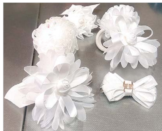
И это только самая малая часть из предлагаемых на рынке бантиков для первоклассниц.