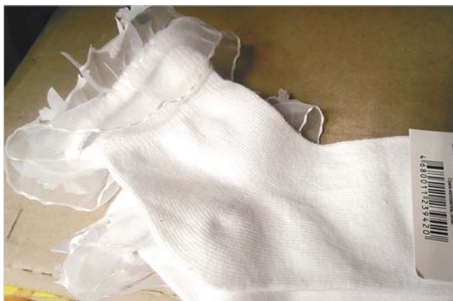
А эти носочки для первоклассницы стоят почти 80 рублей.