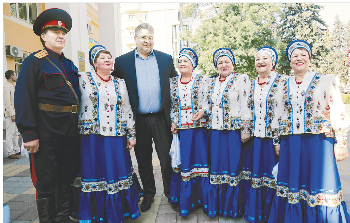
Казачки исполняли песни для избирателей.