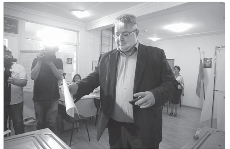
На избирательном участке – Владимир Владимиров.

Со своей стороны, федеральный депутат обещал делать все от него зависящее для помощи реальному сектору экономики Ставрополья. А будущему губер-