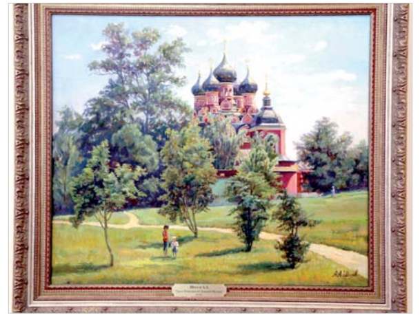
«Храм Тихвинской иконы Божьей Матери».