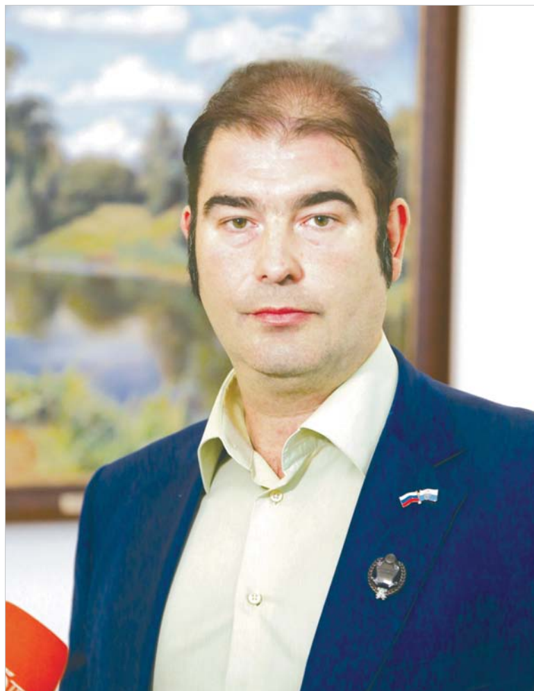
Заслуженный художник России Александр Александрович Шилов.

– Я задался вопросом, что я могу сделать как гражданин Российской Федерации, как художник в ответ на вызовы, на-