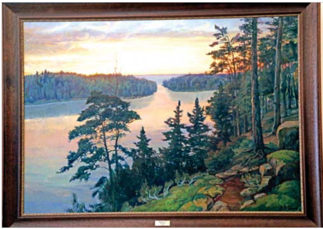
А. Шилов. «Валаам».