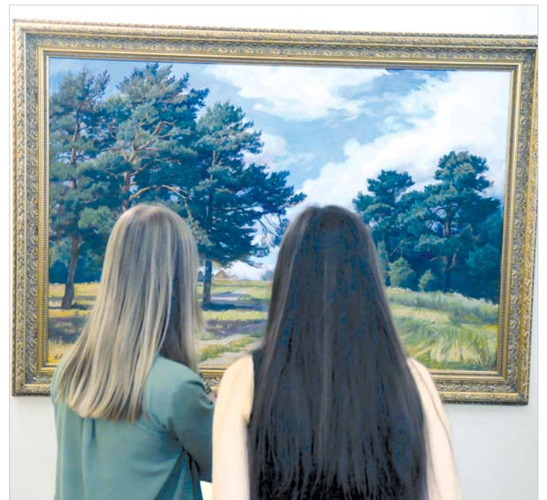
Первые зрители на выставке в Ставрополе.