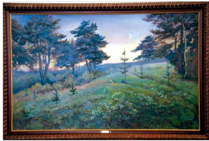
А. Шилов. «Сказочный вечер».