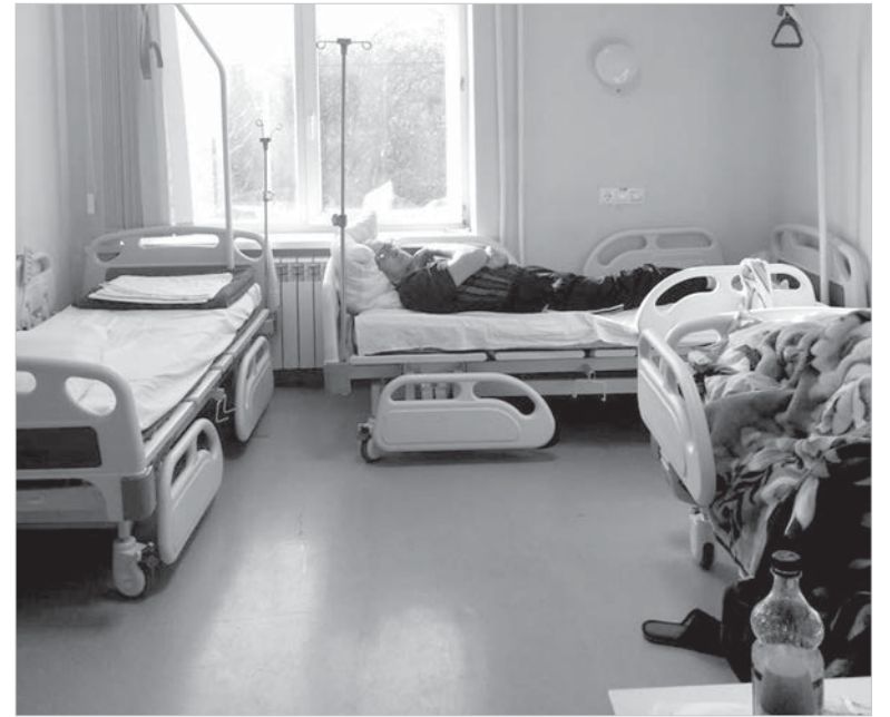
Гериатрическая палата максимально приспособлена к потребностям пожилых пациентов.

- Поскольку мы – городская газета, нашим читателям будет интересно, как представлена гериатрическая служба в Ставрополе. О работе гериатрического отделения на базе третьей горбольницы «Вечерний Ставрополь» подробно рассказывал. Это стационарное подразделение появилось в краевом центре, когда в стране таких были единицы. А что с оказанием амбулаторной медицинской помощи возрастным пациентам?