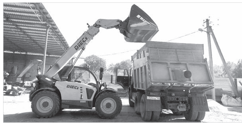
Приобретенная в лизинг техника.