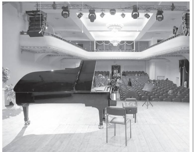
Главный концертный рояль филармонии «Steinway and Sons».