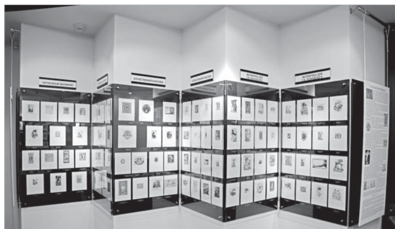
Экспозиция стилистически напоминает книжные страницы.