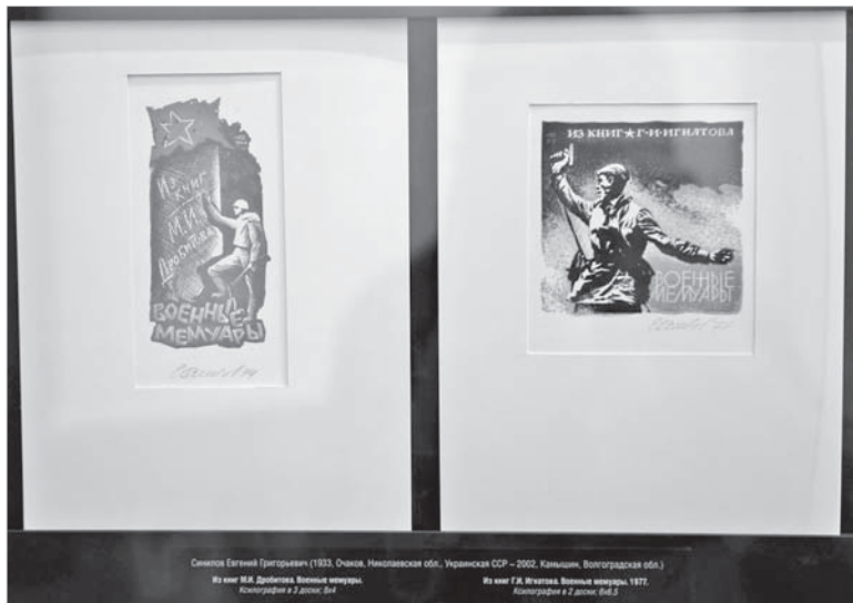
В честь 75-летия Великой Победы одна из тематических подборок была посвящена Великой Отечественной войне.