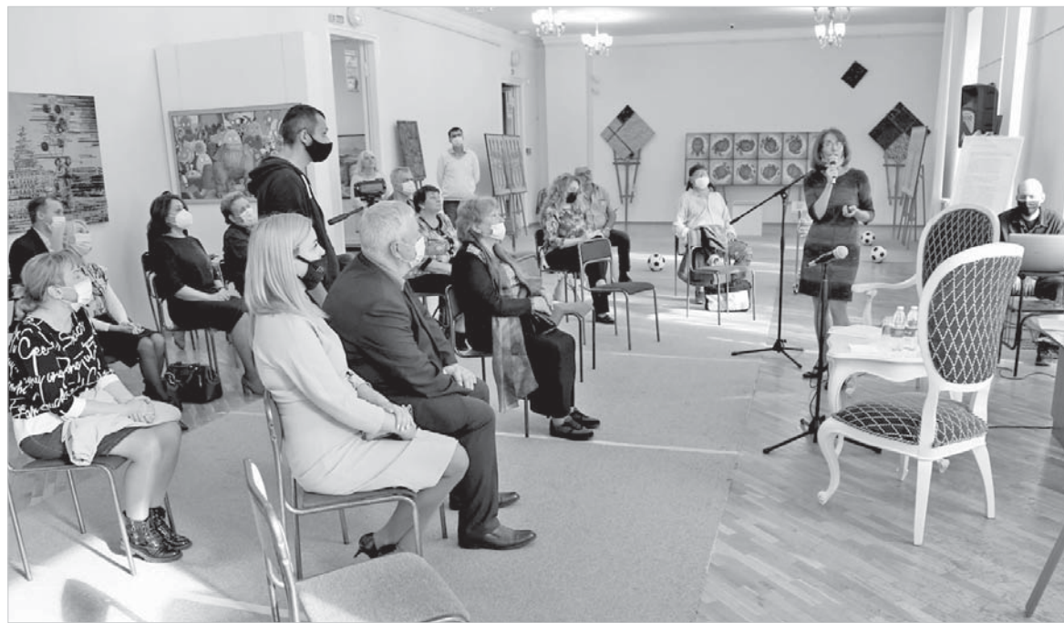
На открытие выставки были приглашены библиотекари, музейщики, художники и коллекционеры.

выделило средства. Оформлена экспозиция действительно оригинально: стенды, на которых размещены 200 экслибрисов, напоминают собой книжные развороты.