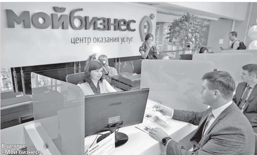
В центре «Мой бизнес».