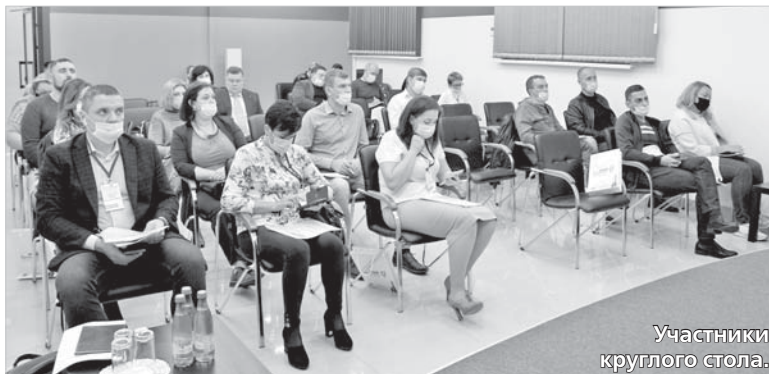
Участники круглого стола.

Одна из самых актуальных услуг центра поддержки экспортно-ориентированных субъектов малого и среднего предпринимательства в Ставропольском крае — размещение на международных торговых площадках. В настоящий момент их несколько, в том числе Alibaba, Amazon, eBay и Europages. Чтобы попасть на них, необходимо пройти анкетирование, в ходе которого будут даны четкие рекомендации. Если под условия предприятия или организации лучше подойдет какая-либо другая электронная пло-