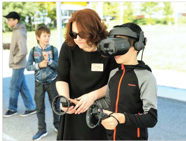
Вот так работают программы виртуальной и дополненной реальности.

т.д.); Айти-школа Самсунг (язык мобильного приложения: основы программирования на языке Java, объектно-ориентированное программирование, алгоритмы и структуры данных, основы программирования Android приложений, алгоритмы и структуры данных на языке Java, основы разработки серверной части мобильных приложений); кибербезопасность, Си-подобные языки программирования, а также программы виртуальной и дополненной реальности. Сейчас в Центре обучаются 404 ребенка. Кроме того, в 2019 году компьютерами, программным обеспечением и презентационным оборудованием были оснащены 49 общеобразовательных и три профессиональных образовательных организации на сумму 112,45 млн рублей.