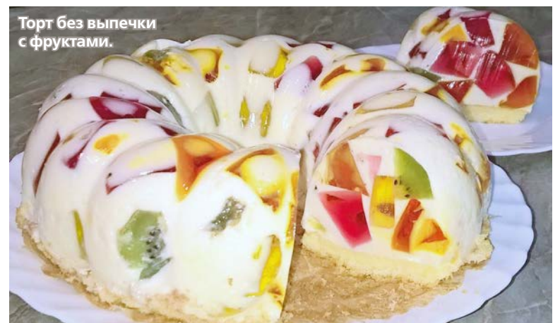
Торт без выпечки с фруктами.