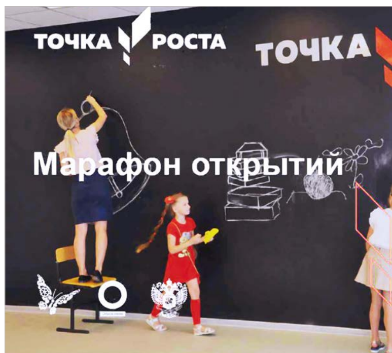
В 26 муниципалитетах края на базе сельских школ открылось 70 Центров образования цифрового и гуманитарного профилей «Точка роста».

В 2019 году в 26 муниципалитетах края на базе сельских школ открылось 70 Центров образования цифрового и гуманитарного