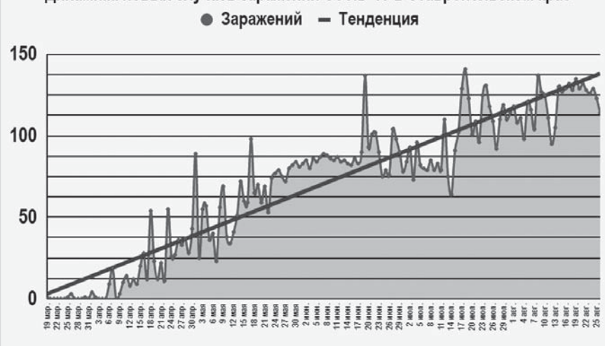
Динамика новых случаев заражений CoViD-19 в Ставропольском крае