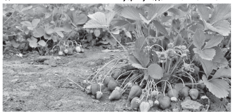
Клубничная грядка снова стала урожайной.