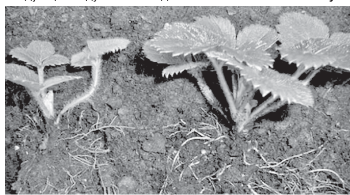
Мужская розетка (слева) и женская.