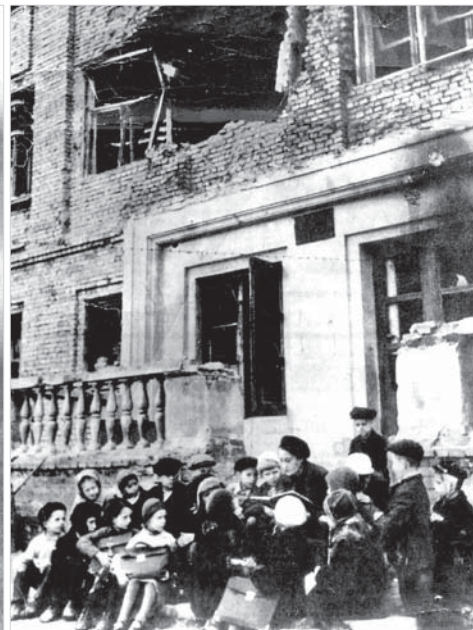
Первый урок у стен родной школы. 1943 год. Государственный архив Ставропольского края.

ознакомиться с документами 1943 года о работе Чрезвычайной государственной комиссии по установлению и расследованию злодеяний немецко-фашистских захватчиков и их сообщников, об итогах работы по учету ущерба, причиненного немецко-фашистскими захватчиками гражданам, колхозам, МТС, совхозам, государственным предприятиям, учреждениям и организациям Ставропольского края. Докумен-