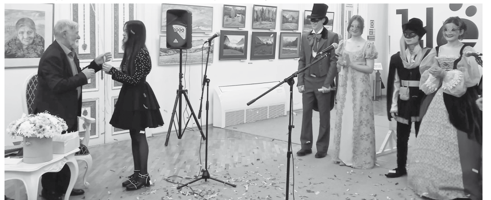
Юбилера поздравляют студенты Ставропольского краевого художественного училища

таклей, которые пользовались и до сих пор пользуются большой популярностью. Разрешите пожелать вам долгих лет жизни, крепкого здоровья и новых творческих побед как по жизни, так и на сцене