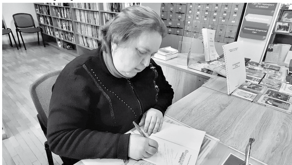
В нем светел Книги книг оклад. В гармонии молитв и звонов Поёт душа на русский лад Среди разлада, войн и стонов.

Не прерывайте песни той И мир незримый сохраните, С его добром, с его мечтой, – Он хрупок, словно солнца нити.