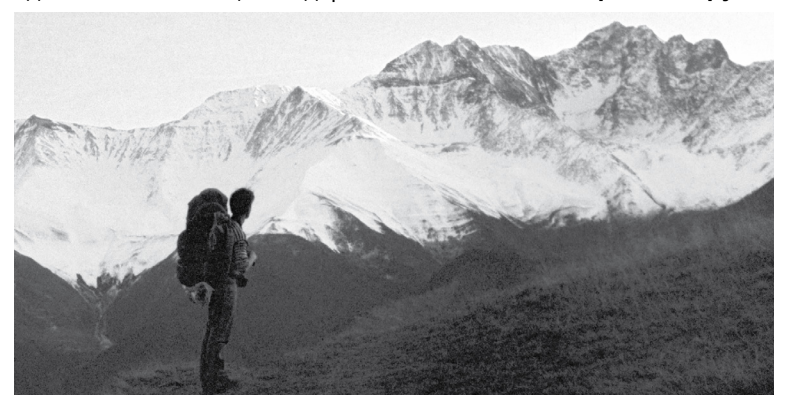
Прощальный взгляд на ингушские горы