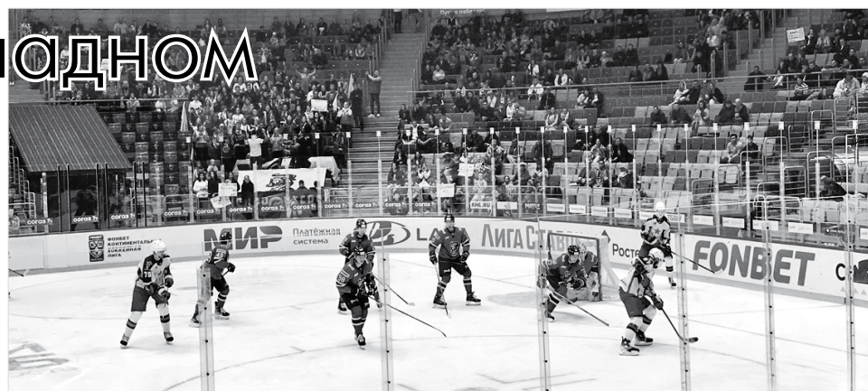
Матч «Сочи» – ЦСКА во Дворце спорта «Большой»

Далее мы исследовали окрестности отеля, прошли под огромной эстакадой, увидев еще закрытое заведение с оригинальным названием «Подмостовье», а также обратили внимание на немалое количество брошенных автомобилей, преимущественно иномарок, среди которых был даже один автобус. Наверное, какие-то последствия бурного курортного сезона, во всяком случае, много объяснения у меня нет. Далее по курсу мы обнаружили достаточно бюджетную столовую, в которой уже по пути на матч с удовольствием подкрепились.