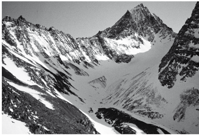
Главная вершина Махисмагали

К концу дня немного выматываемся, не очень верится, что ещё сегодня мы стояли лагерем на снегу, но так часто бывает в горах. С утра ты коченеешь где-то в под-