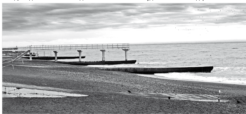
Пустой пляж Адлера в ноябре