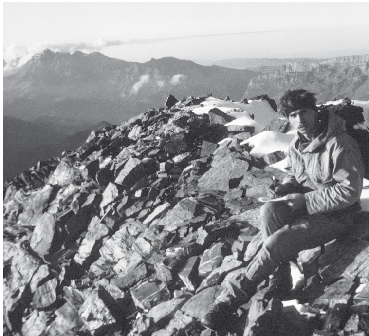
Пишу записку на вершине

небесью, а вечером загораешь в Таргимской котловине!