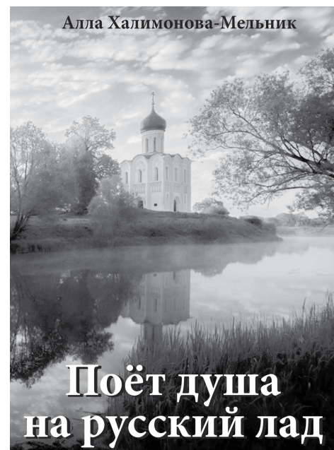
Как колокол вселенских многолетий. Восслав же красоту людских сердец! Любви сосудом их создал Творец. Любите ближних – будете, как дети.

И ярче жизнь от радостных соцветий, И горячей далёкие огни. Скажи об этом, стих мой! Зазвени,