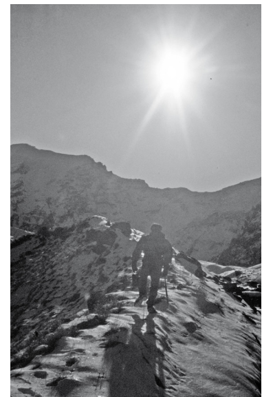
Отставить разговоры – вперёд и вверх, а там...

А мы двигаемся на автопилоте: такого истощения я раньше никогда не испытывал. После восьми часов (вместо четырёх) мы до-