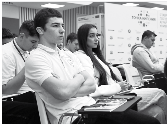
Молодежь Ставрополья учится делать свой выбор

Геннадий КРИШТОФОРОВ. Фото Александра ПЛОТНИКОВА