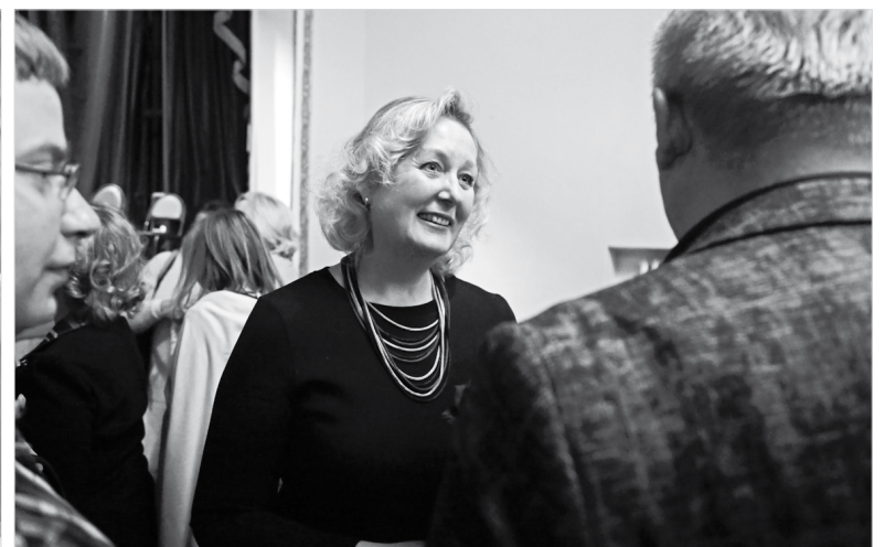
Общение после концерта: композитор Евгения Сафронова и слушатели