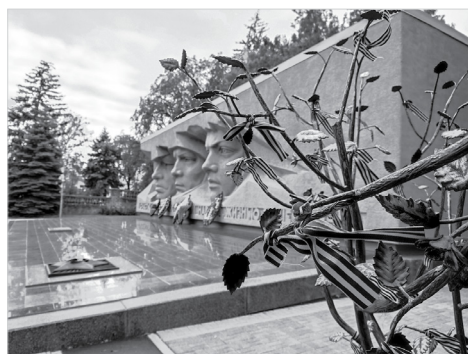
которая только лишь крепнет перед лицом внешней агрессии и угроз».

В память о миллионах погибших советских граждан, о мужестве и отваге наших предков, сокрушивших фашизм и освободивших народы Европы от агрессора, поколения, живущие в XXI веке, вносят свой патриотический вклад в сохранение героических и одновременно трагических страниц истории нашей страны. Нельзя допустить, чтобы были забыты миллионы фронтовиков, партизан, узников фашистских концлагерей, тружеников тыла – представители всех национальностей Советского Союза. Все народы СССР внесли свой вклад в дело общей Победы. По словам Владимира Путина: «Наша держава созидалась вокруг ценностей многонациональной гармонии. Это важнейшая основа нашей консолидации,