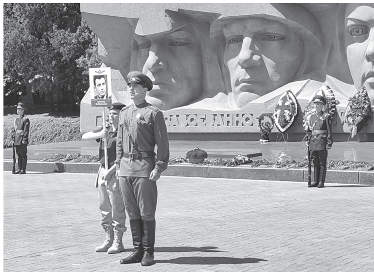
Бессмертный полк. Звучат живые строки