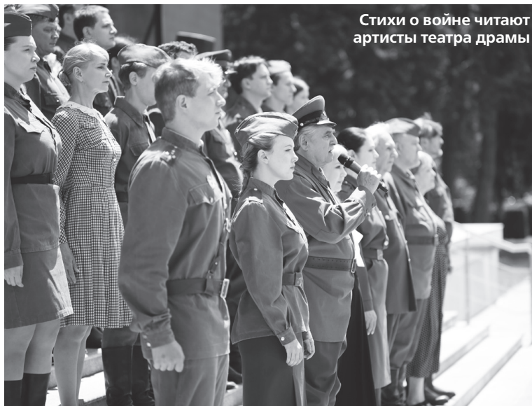
Стихи о войне читают артисты театра драмы