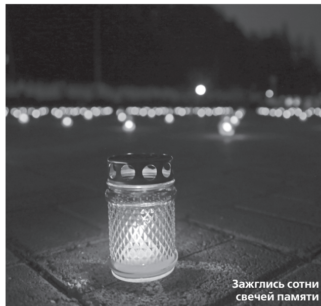
Зажглись сотни свечей памяти