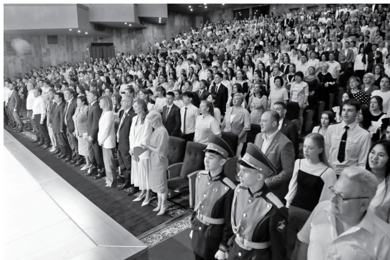
В зале Дворца культуры и спорта гордость Ставрополя

«Много лет назад, не буду говорить сколько, я также стояла на сцене школы № 23 города Ставрополя, мне вручали медаль. Ее получить было сложно. Вы сегодня – яркие, умные, креативные, интересные. Я прошу вас, пожалуйста, поверьте в свои силы!