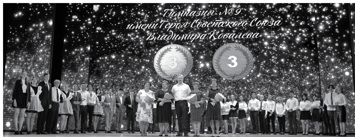
Фотография на память с губернатором

Всего награды получили более 400 выпускников, около 270 из них – золотые медали.