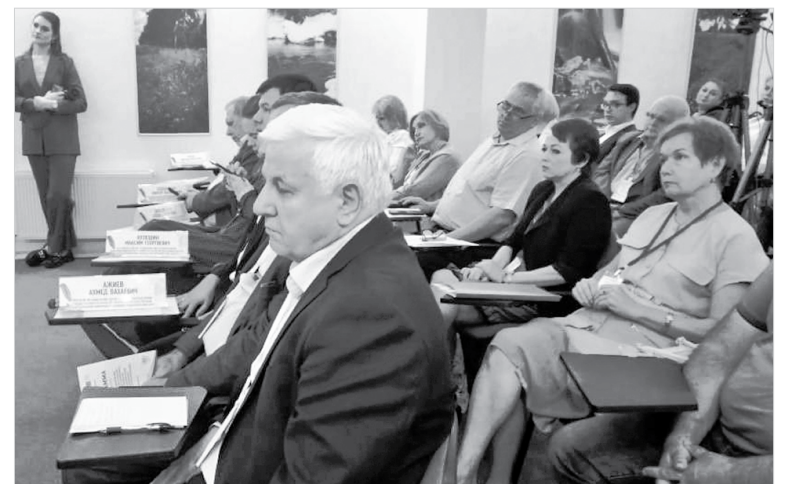
Участники стратегической сессии