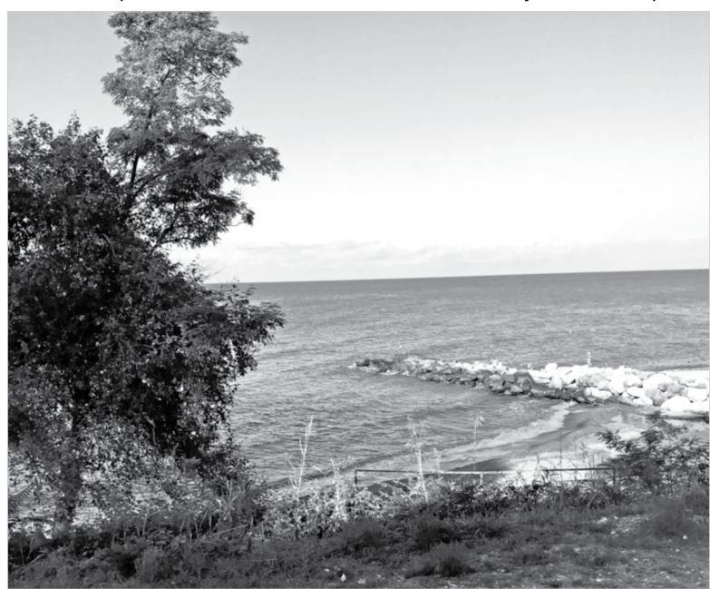
Вид на море из окна поезда