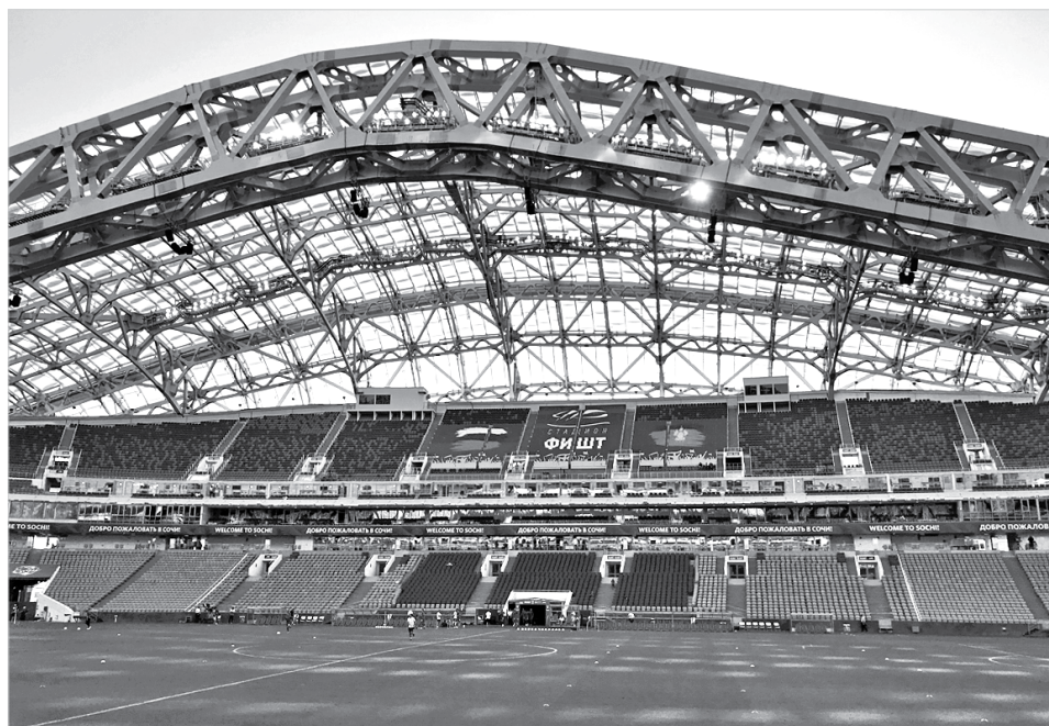
Пустые трибуны стадиона «Фишт» перед матчем

Уже не первый раз, когда я еду поездом на Черноморское побережье, у меня получается отъезд и возвращение в разных точках. Туда стартовали из Ставрополя, благо в нужную дату состав как раз отправлялся. А вот на день нашего отъезда был вариант приобрести железнодорожные билеты только до Невинномысска на поезд Адлер – Кисловодск.