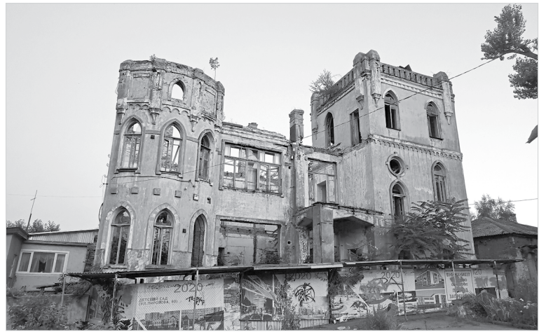
Сегодня это здание еще больше напоминает «дом с привидениями»

Учась в электротехникуме связи, я проходил практику на телефонной станции, которая размещалась в здании, построенном в 1911 году на проспекте Октябрьской Революции. Это была старинная электромашинная станция на 3000 номеров. После работы мы часто гуляли с товарищами по проспекту Октябрьской Революции, который в разные годы носил разные официальные названия (например: улица Воронцовская, Почтовая, Ворошиловский проспект). В народе же во времена рок-н-ролла и твиста его называли «Бродвеем». По вечерам здесь гуляли тысячи празднично одетых горожан, желающих посмотреть