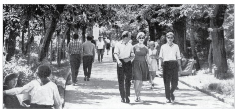
Аллея ставропольского парка.

на других и себя показать, а может быть, и познакомиться с кем-нибудь... Везде слышался смех и оживленные разговоры. Толпа двигалась от перекрестка с улицей Дзержинского до центрального входа в парк и мелкими ручейками растекалась по его дорожкам и тропинкам с огромным количеством красивых кустарников, скрывавших парочки, целующиеся на скамейках.