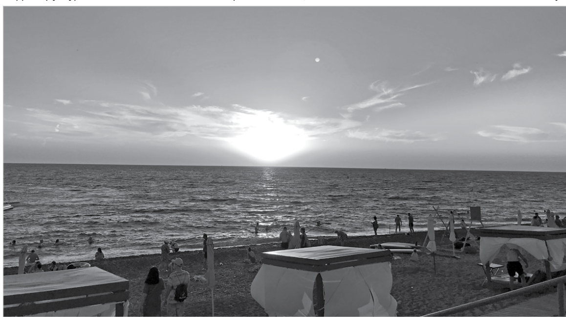
Закат над морем