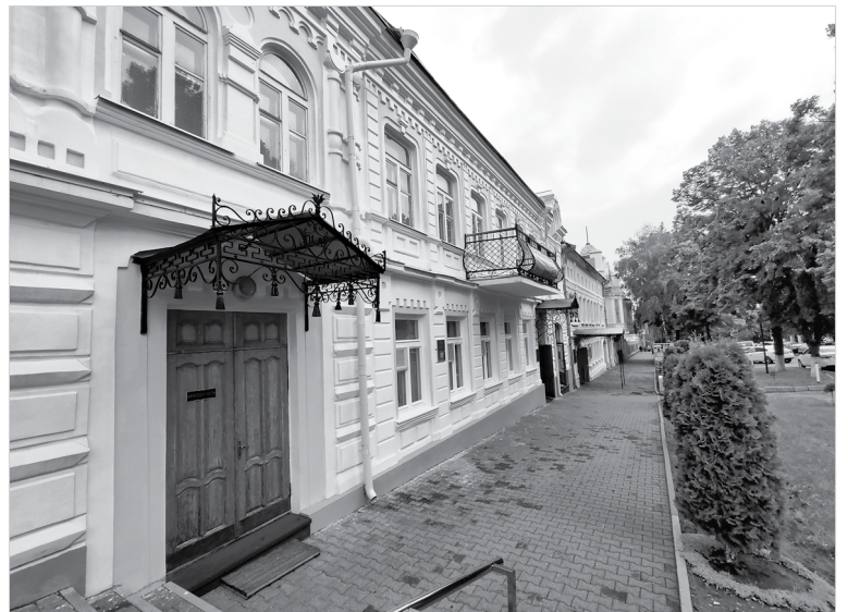
До начала 1990-х годов во дворе музея изобразительных искусств был жилой фонд