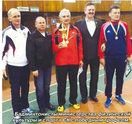
Бадминтонисты министерства физической культуры и спорта СК с победным трофеем.

Прошли соревнования по бадминтону, входящие в программу Спартакиады государственных гражданских служащих Ставропольского края.