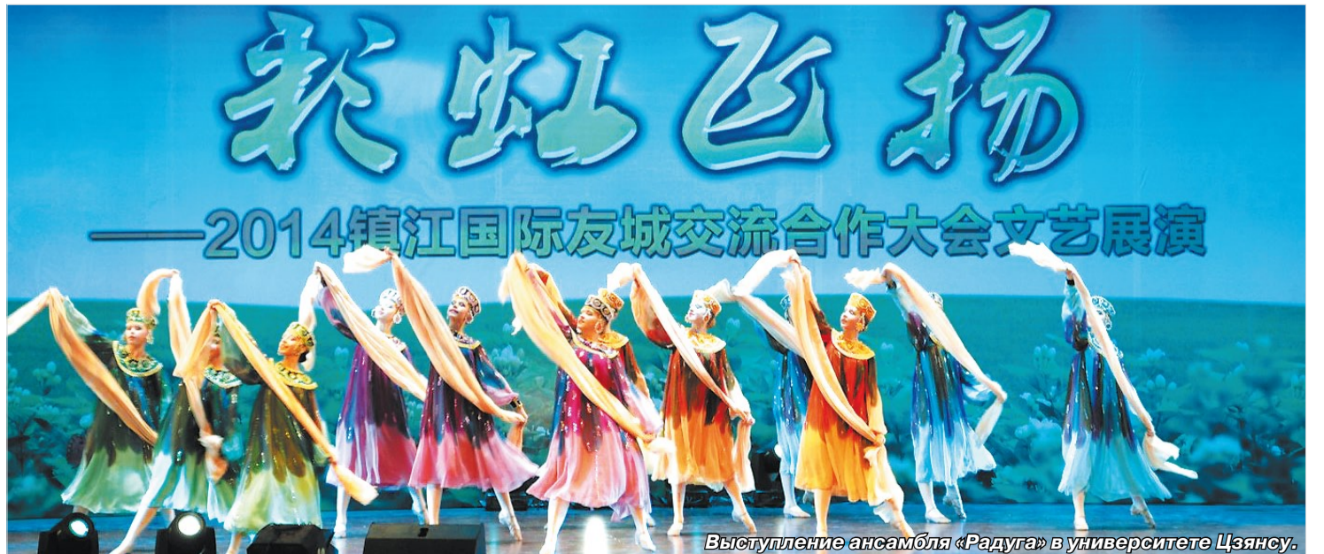
Выступление ансамбля «Радуга» в университете Цзянсу.