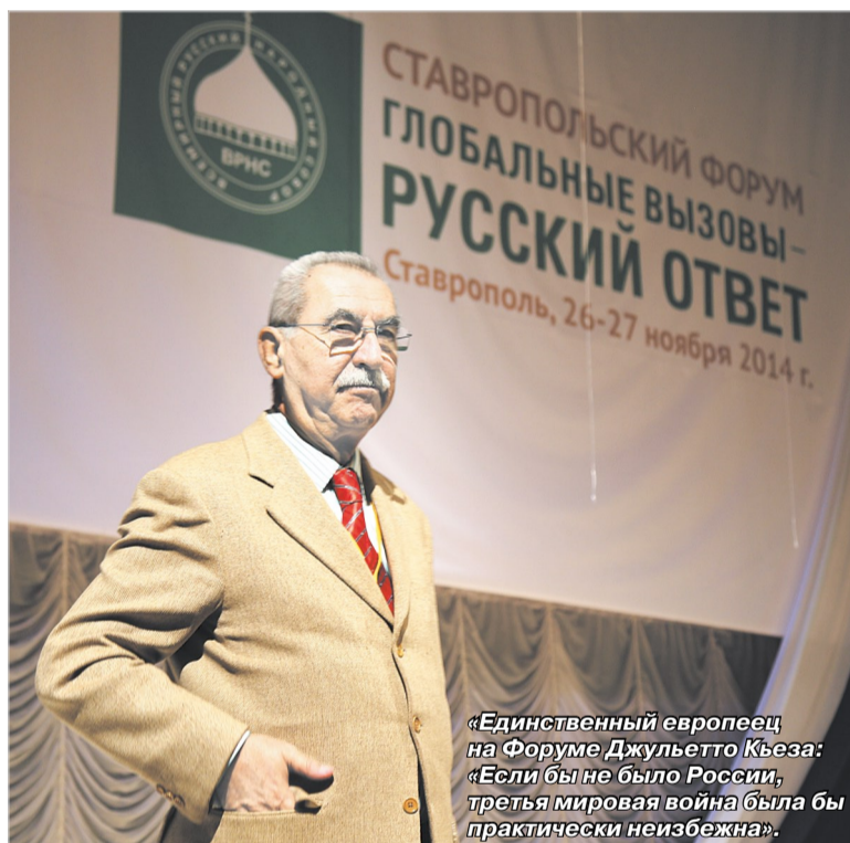
«Единственный европеец на Форуме Джульетто Кьеца: «Если бы не было России, третья мировая война была бы практически неизбежна».

вет внесли свою лепту. И то, что в нашем крае вновь будет проходить Международный славянский фестиваль «Золотой витязь» – это составляющая ответа на глобальные вызовы. Ведь Россия – страна великой культуры и беззаветной, временами самоотреченной любви к Родине. Именно потому она, долготерпеливая и патриархальная, не единожды возрождалась из пепла, именно потому она выигрывала все войны или удерживала мир от войны.