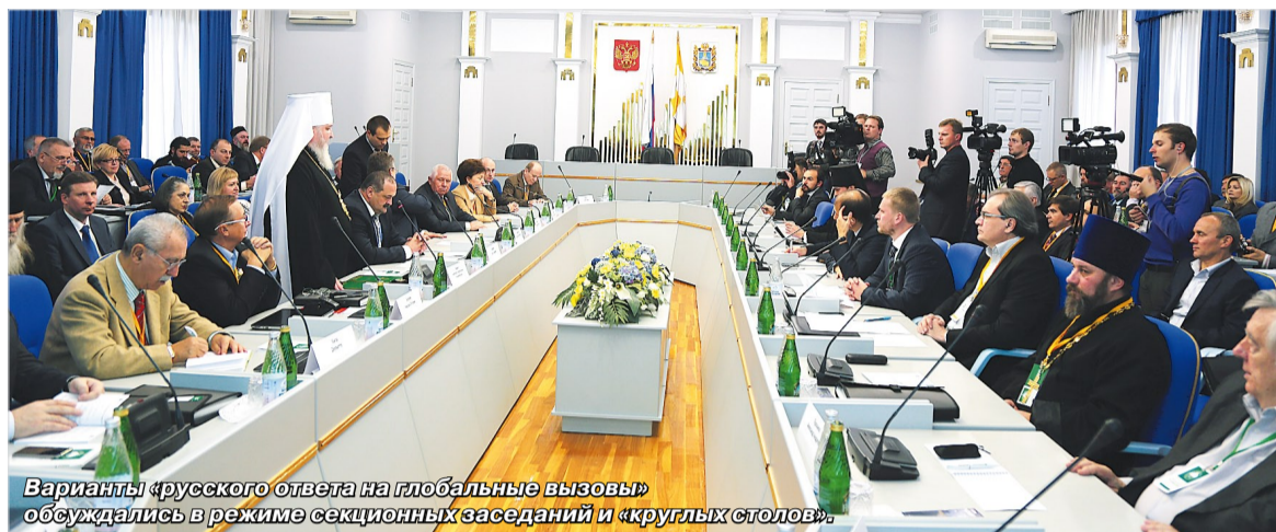
Варианты русского ответа на глобальные вызовы обсуждались в режиме секционных заседаний и «круглых столов».

Поддержал эту мысль и губернатор Ставрополя Владимир Владимиров, перечислив несколько фактов, каждый из которых можно назвать исторической вехой: триумфальная для России Олимпиада в Сочи и возвращение Крыма... Ставропольцы в этот русский от-