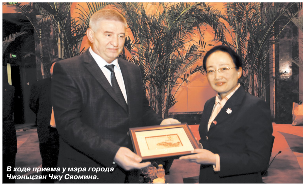
В ходе приема у мэра города Чжэньцзян Чжу Сяомина.