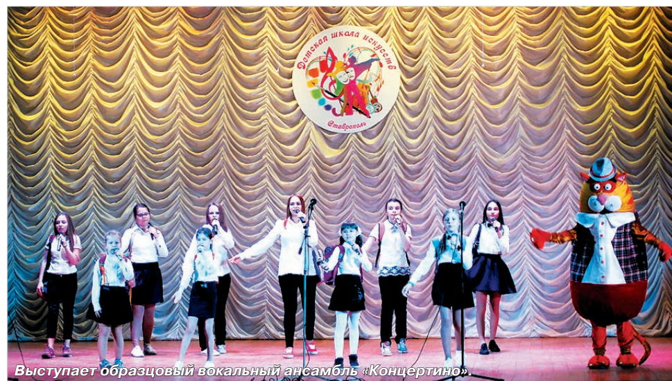
Выступает образцовый вокальный ансамбль «Концертин».

искусству, даже если не стремишься стать профессионалом в этой области. Посмотрев несколько ярких номеров в исполнении учащихся детской школы искусств, кот Аркадий пришёл в такой восторг, что признал свою ошибку.