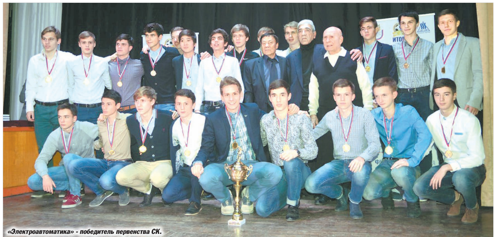
«Электроавтоматика» – победитель первенства СК.