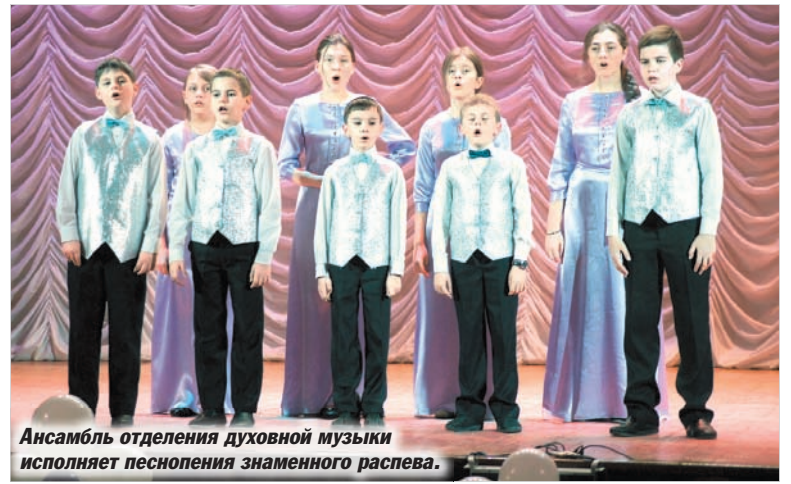
Ансамбль отделения духовной музыки исполняет песнопения знаменного распева.

ятиями на тематику года. Известно, что 2016-й объявлен Годом российского кино. Нужно ли говорить, насколько тесно кинематограф связан со всеми прочими видами искусства?! Безусловно, эта тема может стать не менее благодатной почвой для нового